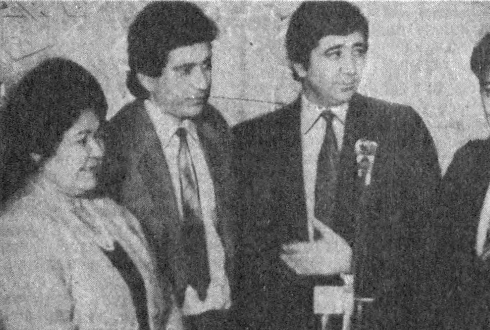
ОТАХОНОВ НОМИ БЕРИЛДИ