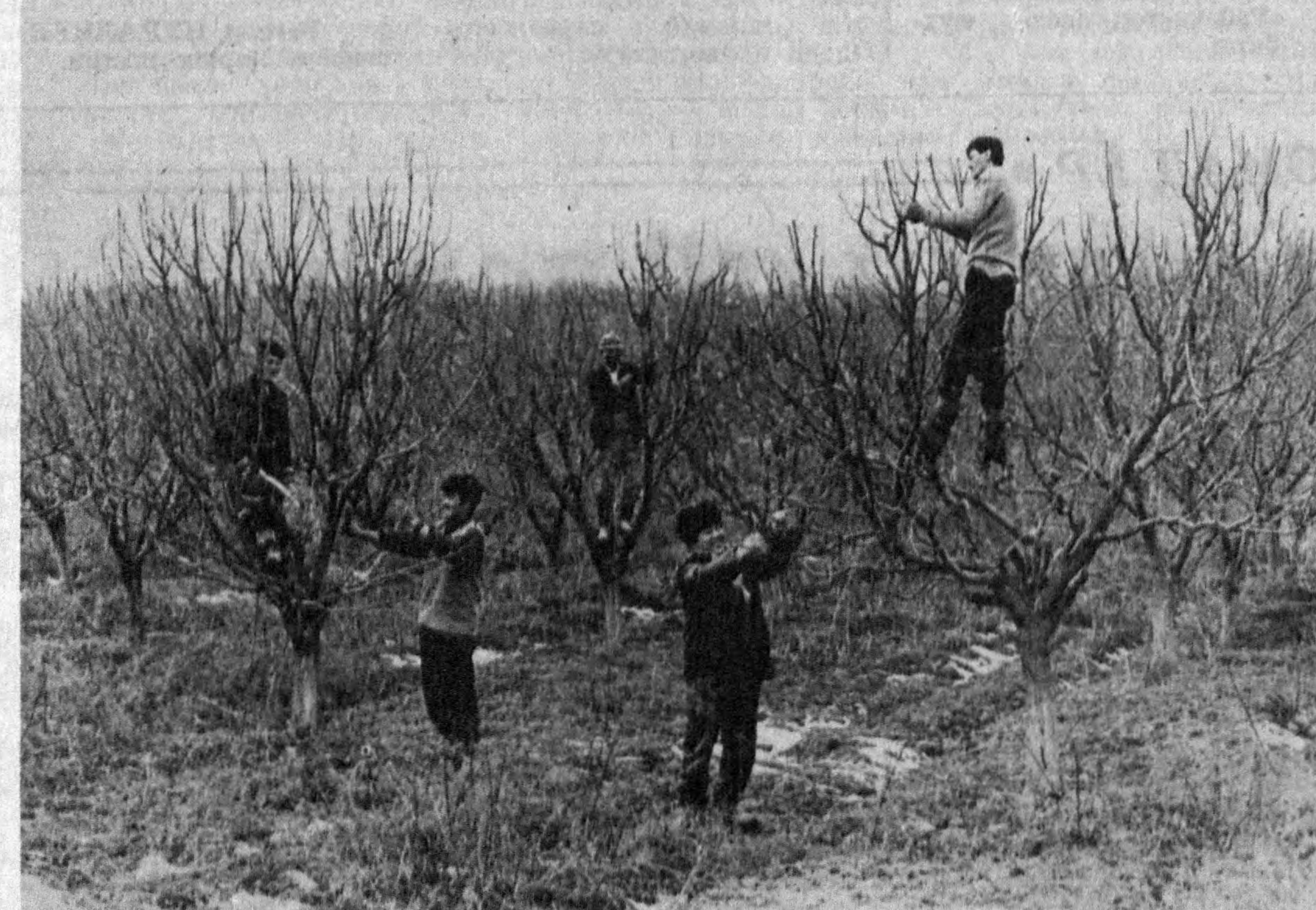
Яна шунинг таъкидлаш жоиз: касаликка чалинган, ҳашаротларга ем бўлган дарахт ва тоқзорнинг ҳосили сифат жиҳатидан талабга жавоб бермаслиги оқибатида ностандарт маҳсулотлар миқдори кўнаиб бораверади. Бу эса табиийки, санаотчиларимизга жидай таъсир келтиради. Ахир ностандарт маҳсулотнинг ўрнини тўлдирш қийин бўлган йўлтиш-да. Бунинг эсдан чиқариш — ўз ризқ-рўзига боғлаш учун билиб баробар.

Шу ўринда тоқзордаги боғларга қайтишга эҳтиёж туғилди. Айтайлик, жамоа ёки давлат хўжалиқининг бог ва тоқзорларида ҳашаротлар қарши дорини чиқариб, бошқа тадбирлар ҳам амалга оширилади. Шунда зараркундаларнинг бир қисми шахсий тоқзорлардаги боғларга «кўчи» ўтади. Демак, улара қарши икки томонлама кураш олиб бориш зарур. Акс ҳолда фойдаси сезилмайди.