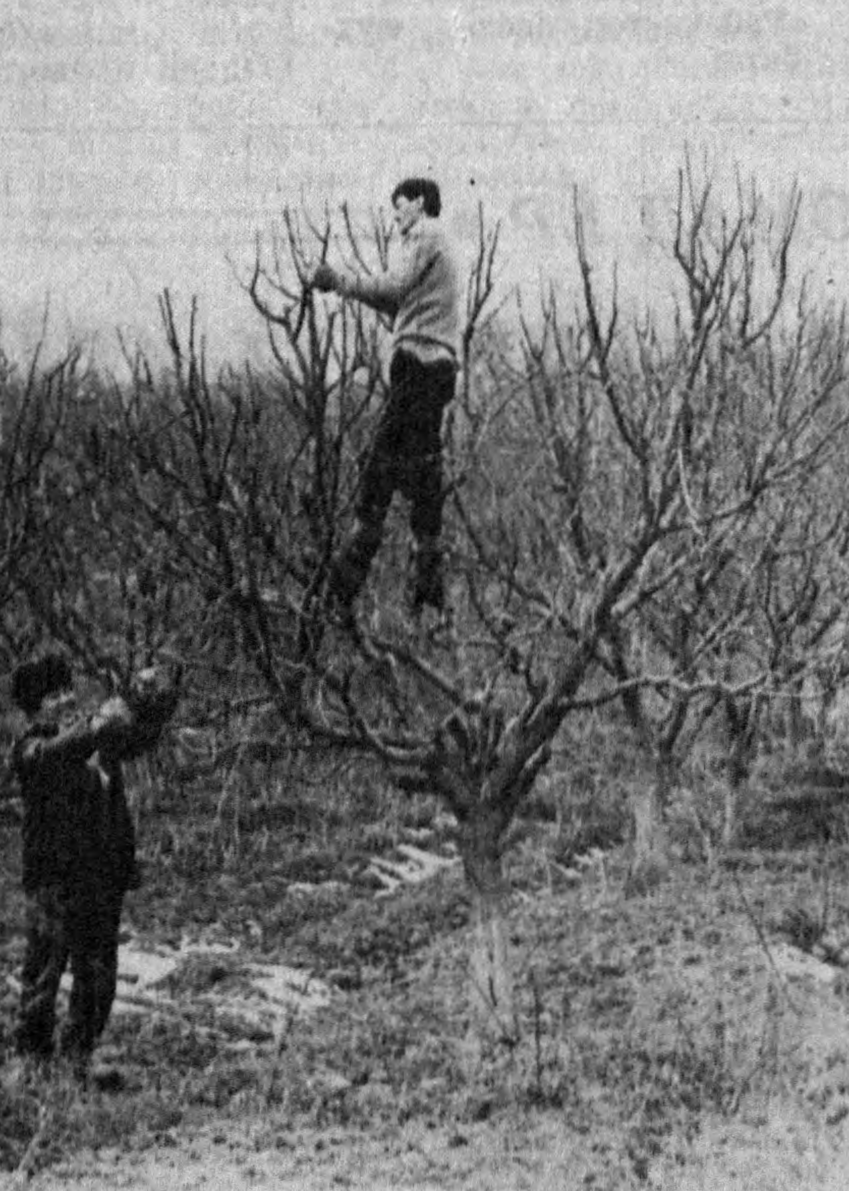
сингари бир қатор салбий жиҳатлар мавжудлиги ҳам кишини ташвишга солади.

Айтман деса гап кўп. Дарахт ва тоқзорни сугоритишнинг истиқболли усуллари кенг қўлланилмаётганлиги, маҳсулотни ташийдиган махсус транспорт воситаларининг етишмаслиги, меваларни қўритадиган ускуналарнинг камёблиги, хом ашёни заха едирмай асрайдиган омборхоналарнинг камлиги, богбон ва соҳибкорларнинг меҳнатига ҳақ тўлаш, уларни рағбатлантириш кўнглидагидек эмаслиги, иқтисодий ислохот одимларининг сустлиги, ижара имкониятларидан фойдаланиш талабга тўла жавоб бермаётганлиги ва шулар