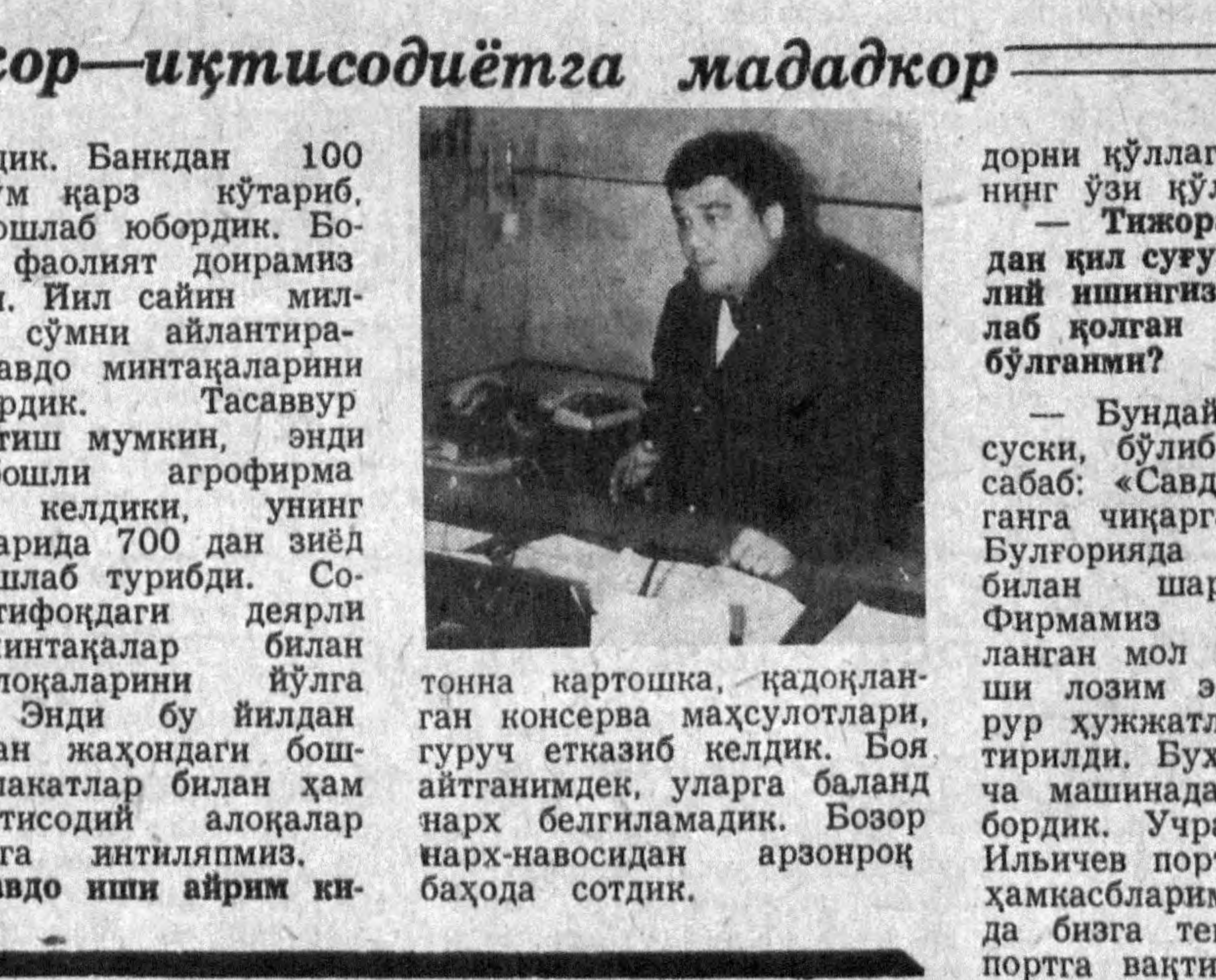
Яндаш Тўраевич, билимизча, олдин қасбни таллаганисиз.