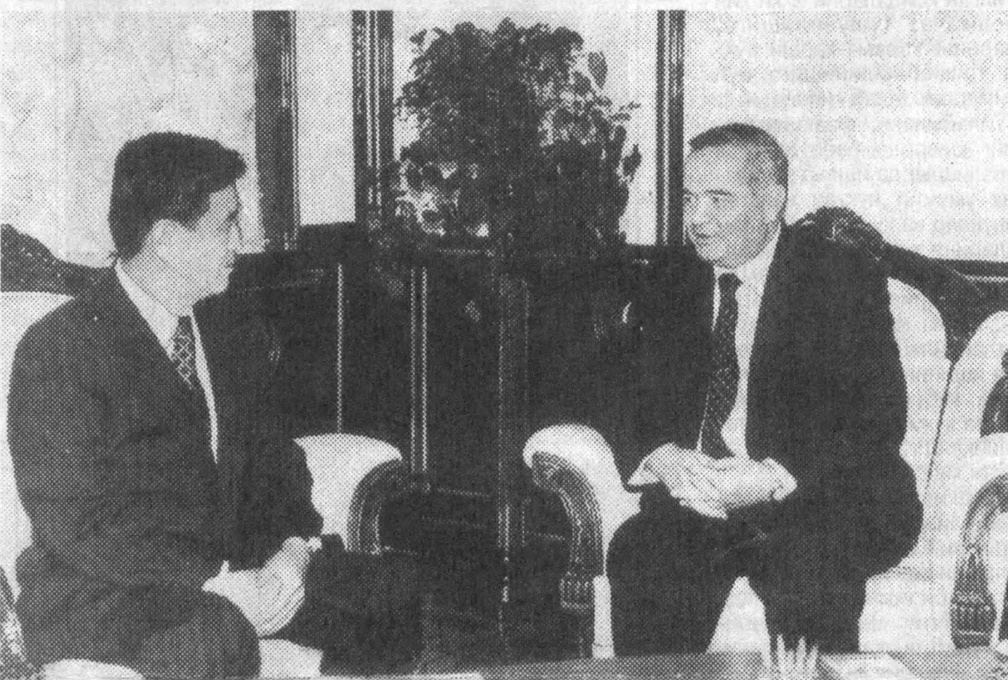
СУРАТДА: суҳбат пайти.