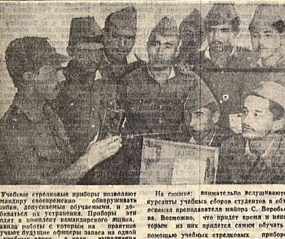
Учебные стрелковые приборы позволяют командиру своевременно обнаруживать ошибки, допускемые обучающимися, и добиваться их устранения. Приборы эти ходит в комплект командирского ящика, правая работа в котором на практике изучают будущие офицеры запаса на одной из учебных точек в ходе выполнения стрельбы из стрелкового оружия.

В учебном центре ТВОУ на занятиях по вождению боевых машин учащиеся постигают эту науку в учебном центре ТВОУ на занятиях по вождению боевых машин.