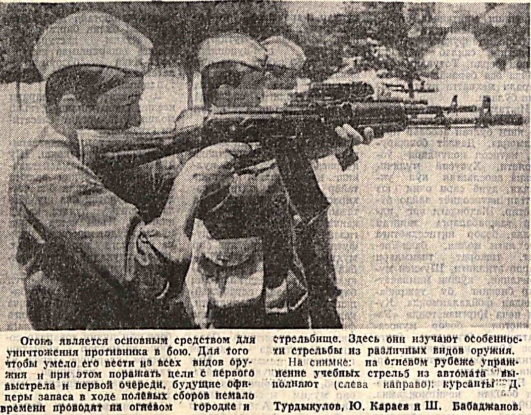
Оғон являється основним средством для уничтожения противника в бою. Для того чтобы уметь его вести из всех видов оружия и при этом поражать цели с первого выстрела в первой очереди, будущие офицеры запаса в ходе полевых сборов немало времени проводят на огневом городке и стрельбище. Здесь они изучают особенности стрельбы из различных видов оружия.

Шу билан бирга Туркистон тарихи, аждодларимизнинг ҳарб илмига қай даражада эътибор берганини ҳақида тўхталиб ўтишган. Талабалар мутахассисликларига қараб, алоҳида синфларда ўқитилди. Ҳарбий, ички ва қорувлик Низомилардан кўришлар тартиб билан ўқитилган.