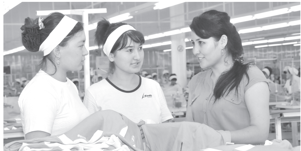
Особо следует отметить условия, созданные для сотрудников ООО «Lens textile invest». Они обеспечены спецодеждой, горячим питанием в уютной столовой на 120 мест, служебным транспортом.

В преддверии Дня независимости в районе будут введены в эксплуатацию еще два аналогичных предприятия, что позволит повысить его промышленный потенциал, создать рабочие места для молодых специалистов.