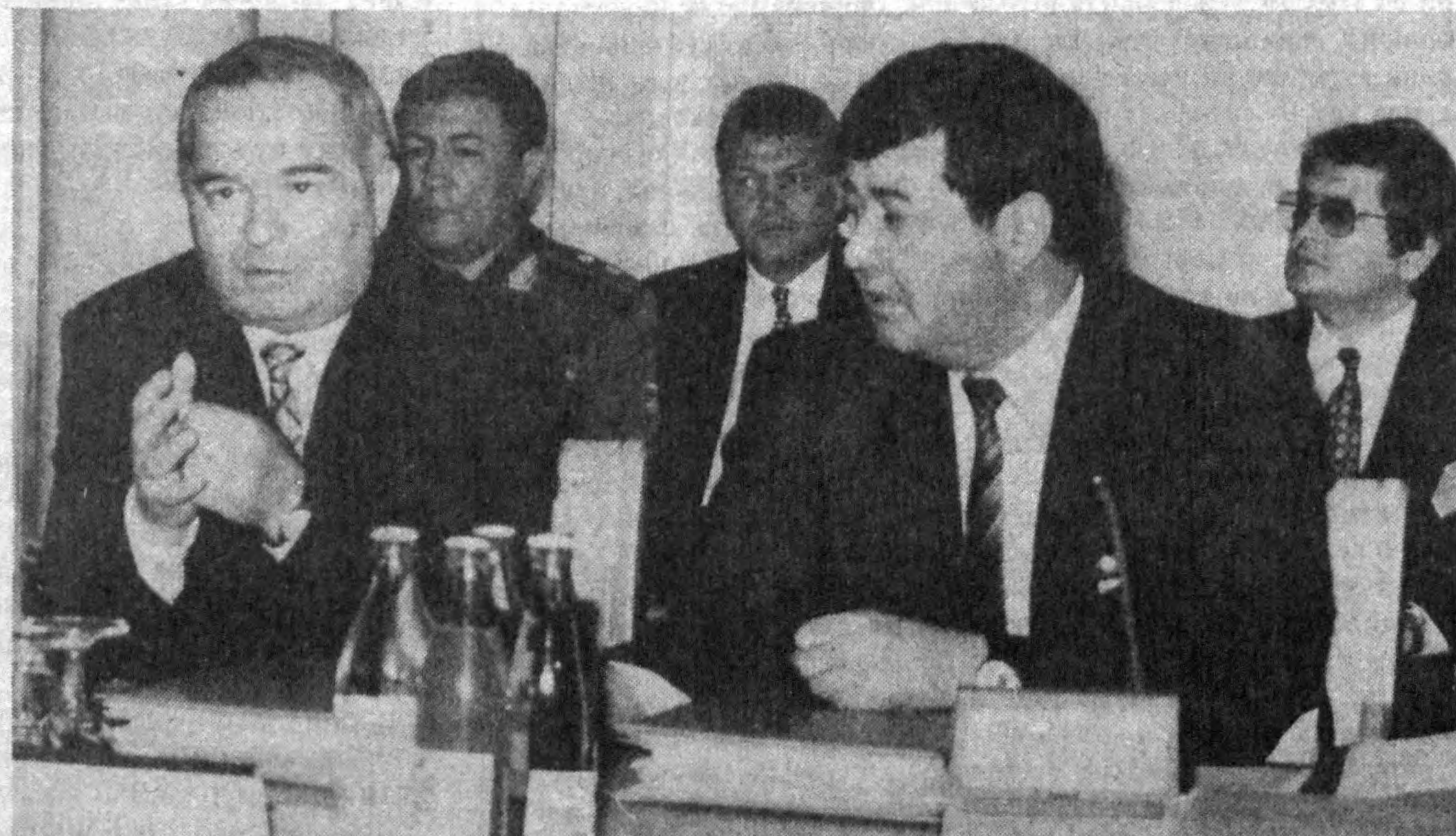
Суратда: учрашув пайти.