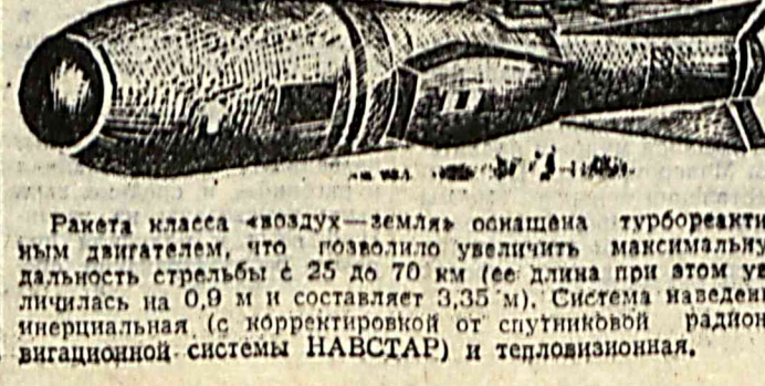
Ракета класса «воздух-земля» оснащена турбореактивным двигателем, что позволило увеличить максимальную дальность стрельбы с 25 до 70 км.