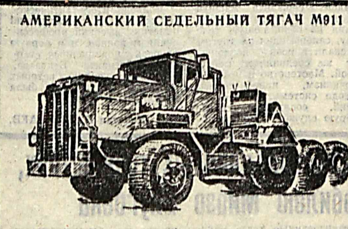
АМЕРИКАНСКИЙ СЕДЕЛЬНЫЙ ТЯГАЧ М011

Именно такими словами напутствия открылся торжественный митинг, посвященный отпуску юношей в службу в Вооруженные Силы Республики Узбекистан.