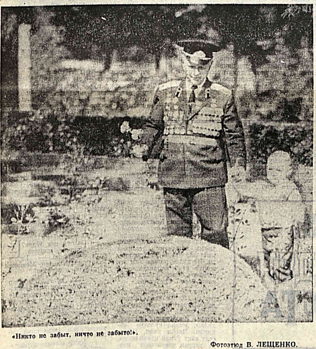
«Никто не забыт, ничто не забыто!».

Бандихон туманидаги «Пактакор» жамоа хўжалиғининг ички минтага яқин аҳоли истиқомат қиладиган Янгикишлоқ, Муна ва Деҳқонobod сингари чечка кишлоқла-