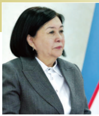
Робохон МАХМУДОВА, Ўзбекистон Республикаси Олий суди раисининг биринчи ўринбосари

Ҳулоса қилиб айтганда, мамлакатимиз суд-ҳуқуқ соҳасида гендер тенгликка эришиш, ўз навбатида, хотин-қизларимизнинг қонуларда белгиланган ҳуқуқ ва эркинликларини ҳимоя қилишини таъминлайди. Шу билан бирга, бу йўналишдаги муҳим қадимлар соҳани жаҳон стандартларига яқинлаштириш, коррупция ҳолатларининг олдини олиш, жамиятда адолат ва қонуни устуворлигини таъминлашга хизмат қилади.