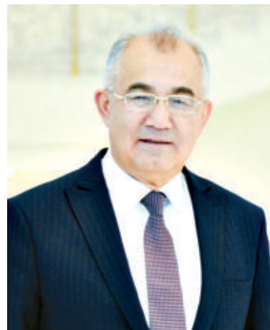
Акмак САИДОВ, академик

Шавкат МИРЗИЁЕВ, Ўзбекистон Республикаси Президенти