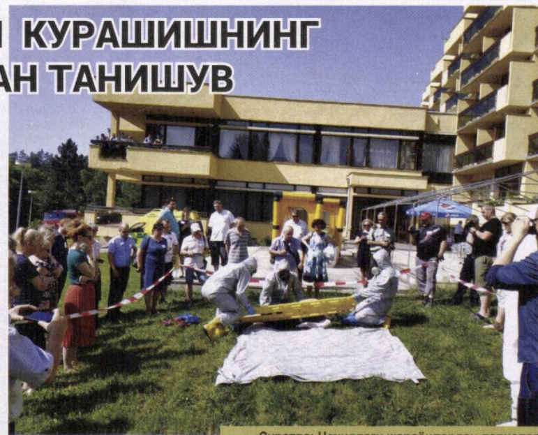
Суратда: Чехиядаги жараёнлардан лавҳалар

Вирусни юқтирилганликда гумон қилинган беморни ўз жойидан шифохонага олиб бориш учун ишлаб чиқарилган “BIO-BAG EBV-30/40” капсуласи делегациямиз аъзоларида алоҳида қизиқиш уйғотди. Капсула турли бактерия ва вирусларни тутиб қолиш ҳамда дезинфекциялаш хусусиятига эга. Ушбу ка-мерада иммунитетни паст беморларни ҳам бир жойдан иккинчи жойга кўчириш мумкин. Беморни доимий назорат қилиш, алоқада бўлиш имкониятлари мавжуд. Капсулага нафас олиш ускунасини, ЭКГ электродларини улаш ҳам мумкин. Ундан вертолёт, тез ёрдам машинаси ва бошқа транспорт воситаларида фойдаланса бўлади.