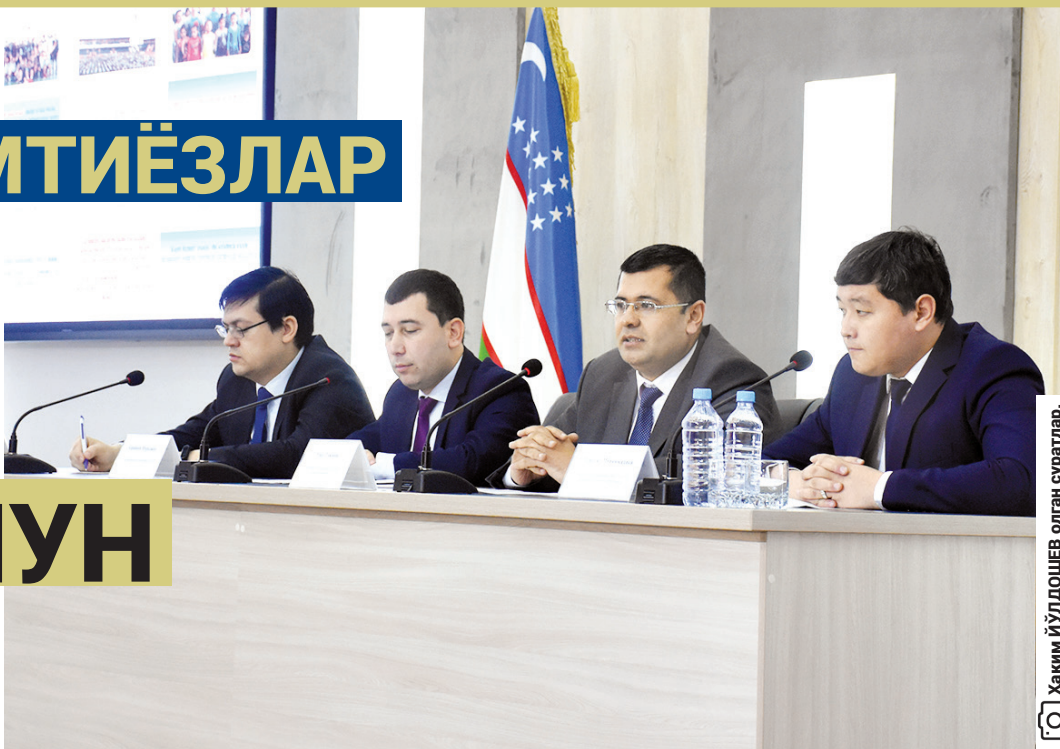
Ханим Йўлдошев олган суратлар.

ПРЕЗИДЕНТИМИЗ ТОМОНИДАН илгари сурилган 5 ТА МУҲИМ ТАШАББУСНИНГ ИККИНЧИ Йўналиши — ёшларни жисмоний чиниқтириш ва спорт соҳасида ўз қобилиятини намойён қилишлари учун зарур шароитлар яратиб бериш БОРАСИДА турли лойиҳалар амалга оширилмоқда.