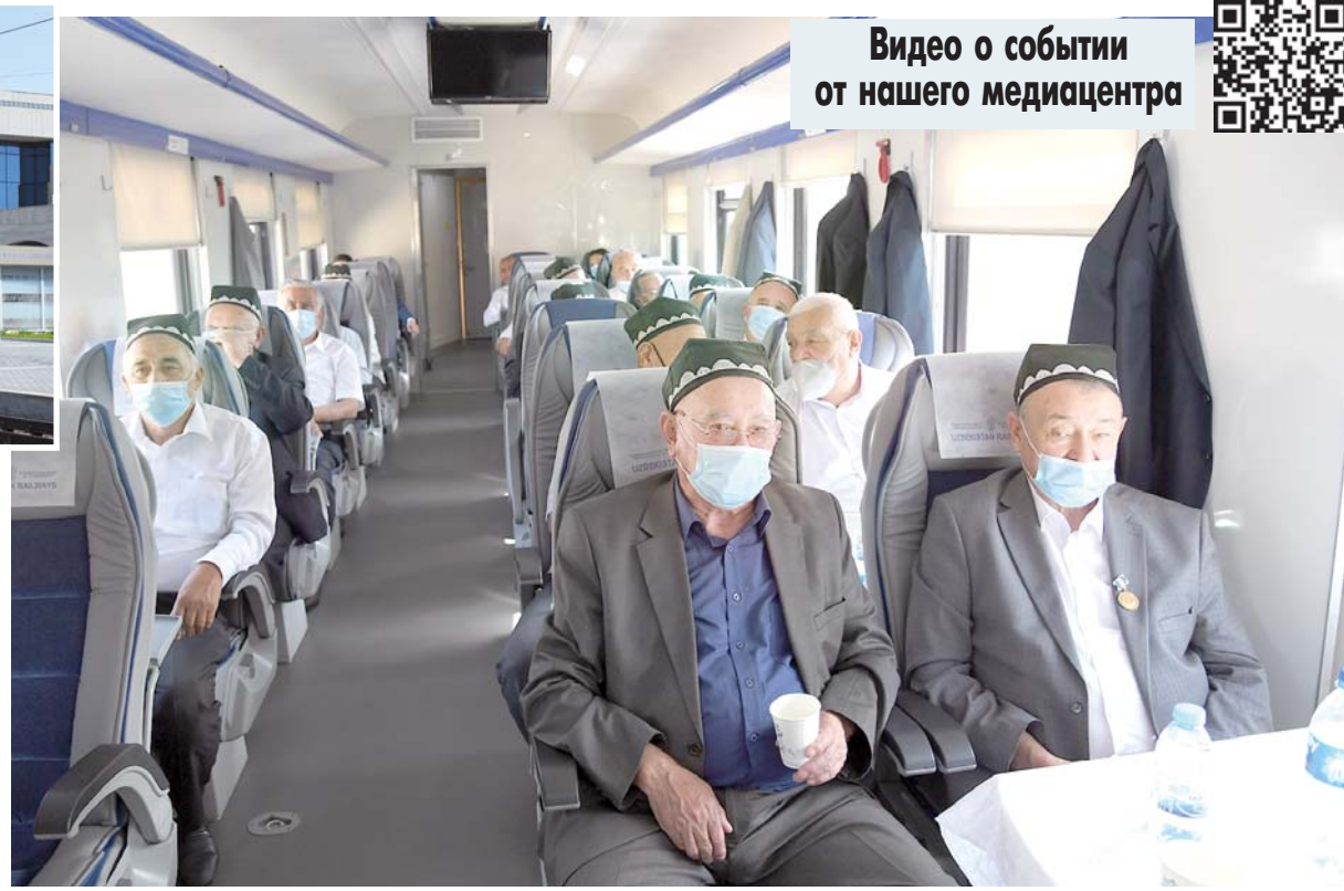
Видео о событии от нашего медиацентра

Начало электрификации кольцевой железной дороги по всем трем областям Ферганской долины было положено четыре года назад после ввода в строй магистрали Ангрэн — Пап. 331,6 километра — такова протяженность железнодорожного маршрута Коканд — Наманган — Андижан — Коканд. В ближайшее время будет налажено регулярное движение поездов. Это создаст удобства для населения Ферганской долины, придаст новый импульс как развитию экономики, так и увеличению потока туристов. Возрастает скорость движения электропоездов. Улучшится и экология: тепловозы, использующие дизельное