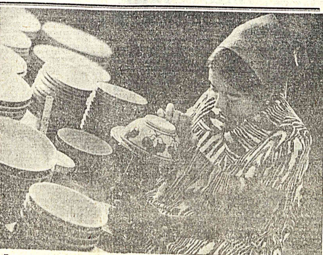
Ташкентский керамический завод. За росписью национальной посуды.

Как ни печально констатировать, но факт остается фактом: сейчас немало молодых людей никак не поймут, что есть то, что есть. «Что такое хорошо, что такое плохо», этим пользуются те, кто хочет заблудить в памяти подрастающего поколения нравственные принципы отцов и дедов. Чтобы наследники отцов победителей фашизма забыли своих героев, стали равнодушны к мужеству и страданиям предков.