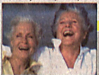
Показатель IQ важен для жизни