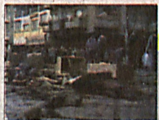
В Багдаде смертник взорвал себя

Правительство Кении не приняло гуманитарную помощь из Новой Зеландии.