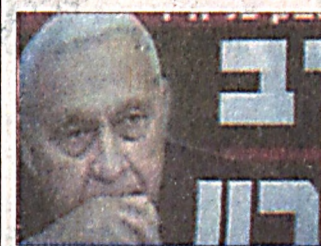
Шарон вновь прооперирован

Премьер-министру Израэлю Шарону сделана еще одна операция. Премьер-министр Израэля по-прежнему находится в глубокой коме.