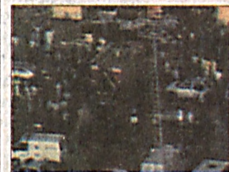
Обрушение на олимпийском объекте

Премьер-министру Израэлю Шарону сделана еще одна операция. Премьер-министр Израэля по-прежнему находится в глубокой коме.