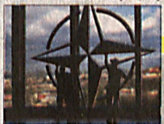
Украина надеется быть в НАТО уже в 2008 году

В результате теракта, совершенного на юге иракской столицы, по разным данным, восемь или девять человек погибли и около 50 получили ранения.