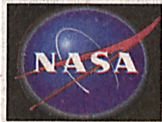
NASA высадит человека на Луну в 2017 году

Палестинская группировка «Хамас» готова обсуждать с международным сообществом вопрос о перемирии с Израилем.