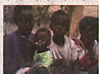
Отказ от гуманитарной помощи

Американское космическое ведомство приступило к пересмотру программы возвращения человека на Луну.