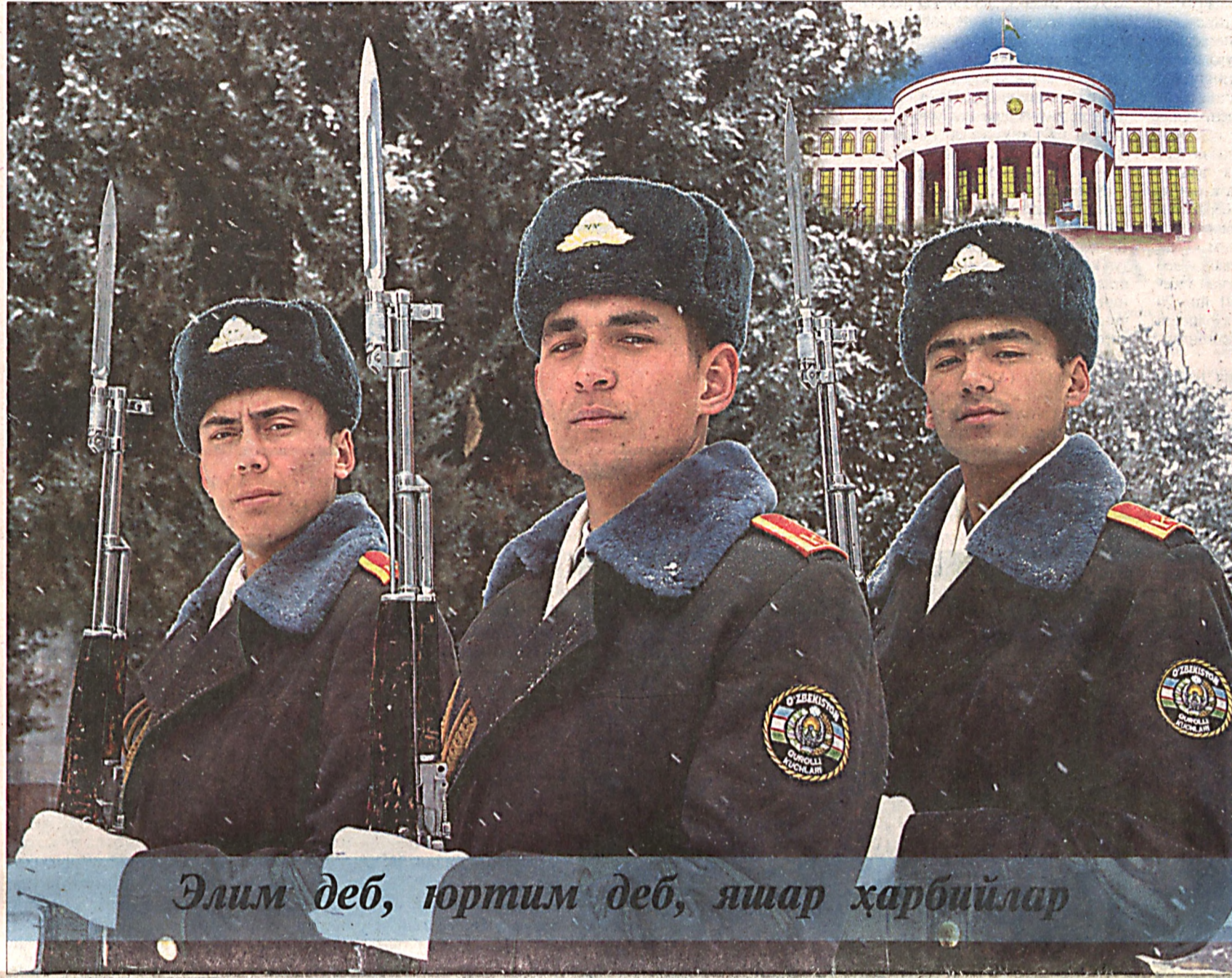
Элим деб, юртим деб, яшар ҳарбийлар

Биз ҳеч кимдан кам эмасмиз, ҳеч кимдан кам бўлмаймиз ҳам!