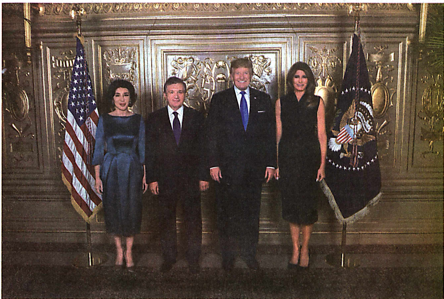
19 сентября 2017 года в Нью-Йорке состоялся официальный прием от имени Президента Соединенных Штатов Америки Дональда Трампа в честь глав иностранных государств и правительств, участвующих в 72-й сессии Генеральной Ассамблеи Организации Объединенных Наций. В мероприятии принял участие Президент Республики Узбекистан Шавкат Мирзиёев с супругой.

Итоги визита Президента Республики Узбекистан Шавката Мирзиёева в США так оценивают отечественные и зарубежные эксперты