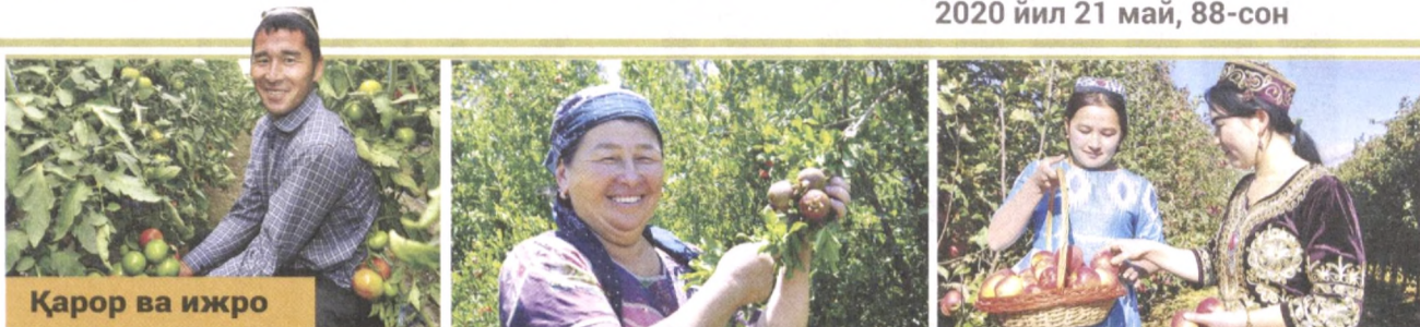
Қарор ва ижро