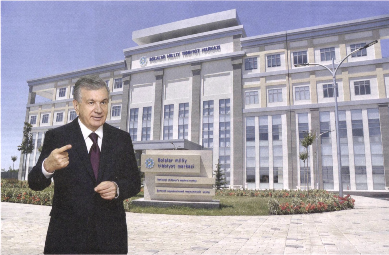
Ўзбекистон Республикаси Президенти Шавкат Мирзиёев 20 май куни пойтахтимизда амалга оширилган бунёдкорлик ишлари ва йирик лойиҳалар билан танишди.