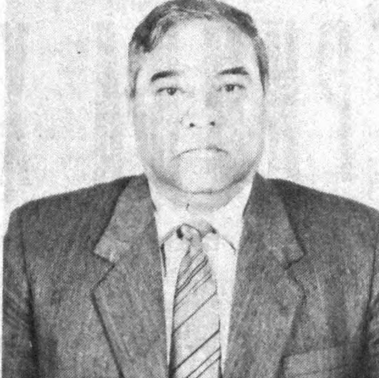
Мирзажон ИСЛОМОВ. Фарғона вилояти ҳокими

Ўзбекистонда унинг номи билан боғлиқ бўлмаган, унинг ташаббуси, диққат-эътиборидан четда қолган бирор-бир корхона қурилиши, янги ўзлаштирилдиغان ер ёки илм-фан даргоҳи йўқ эди. Биз фарғоналиклар Шароф ақанинг ўғитларини кўп тинглаганми. Унинг покиза инсон сифатидаги фазилятларини яхши биламиз. Вилоятнинг бутунги камоли, Фарғона, Қўқон ва Марғилондаги улкан саннат корхоналарининг барпо бўлиши, Марказий Фарғона чўлларининг гулистонга айланишида катта фан-техника потенциалнинг ташкил топишида Ш. Рашидовнинг хизмати беқиёс.