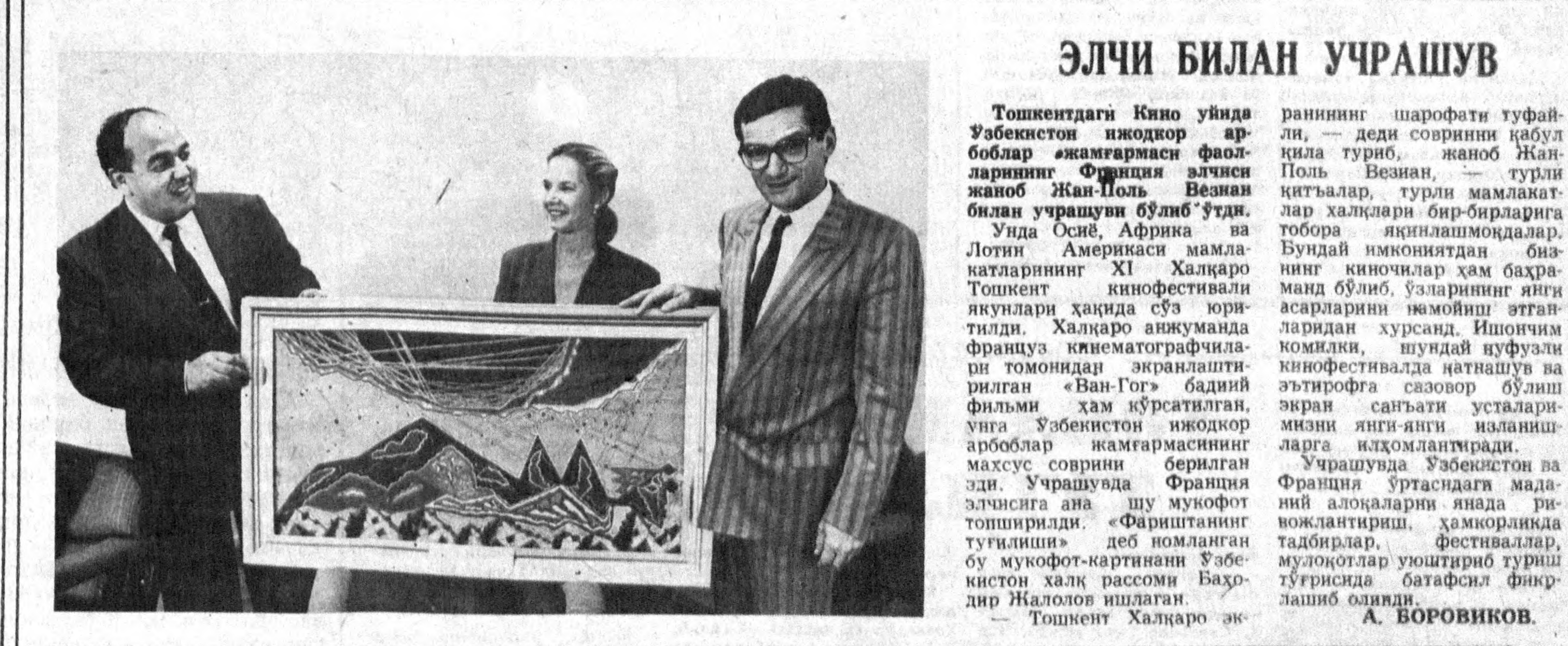
Ташкентдаги Кино уйда Ўзбекистон иждоқор арбоблар жамағатининг Француз элчиси Жан-Поль Везан билан учрашуви бўлиб ўтди.

Дарҳақиқат ҳар иккала иншоот қурилиши анча йилга чўзилиб кетди. Албатта, бунда қурувчиларнинг ҳам, бюрократларнинг ҳам айби бор. Сирасини айтганда, жамоа бўлиб фойдаланишдаги ҳисоблаш маркази (ВЦКП)нинг лойиҳада техника қарорлар бир неча бор ўзгариб турди.