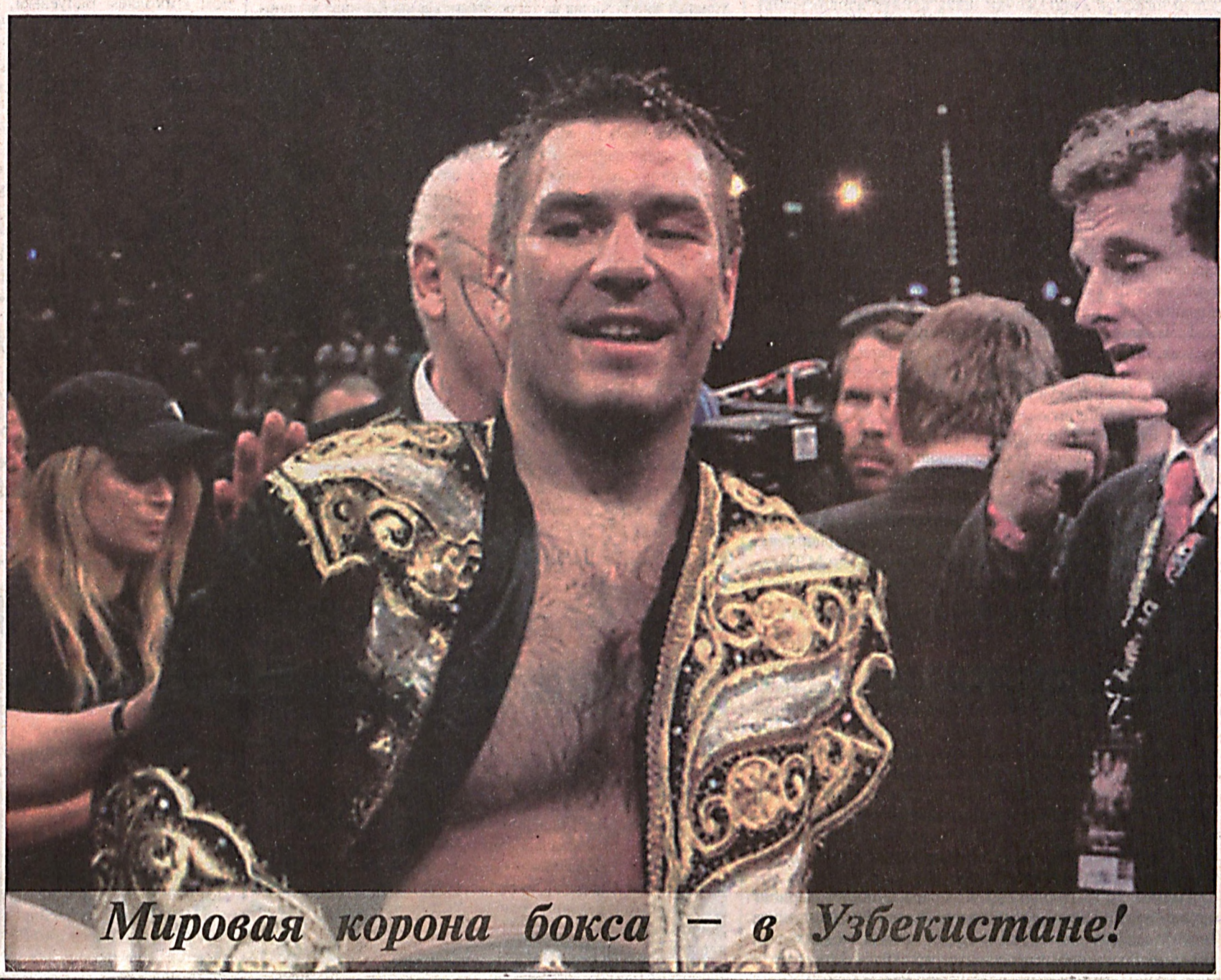
Мировая корона бокса — в Узбекистане!

БОКС БЎЙИЧА ЎТА ОҒИР ВАЗНДА ЖАҲОН ЧЕМПИОНИ РУСЛАН ЧАГАЕВГА Қадри Руслан ўғли! Сени эришган улкан галабанг билан чин қалбимдан самимий муборакбод этаман. Бутун Ўзбекистон аҳли бугун сенинг спорт оламида кўрсатган бекдас жасоратингни байрам қилмоқда. Биз ўзбек бокс мактабида тарбия топиб камолга етган сендек ўғлопинингнинг тарихий галабани қўлга киритиб, ўта оғир вазнда жаҳон чемпионлигига эришгани билан ҳақли равишда фахрланамиз. Сенинг ҳалол ва мurosасиз курашлар остида ўтган ғоят кескин беллашууда сайёрамизнинг энг кучли боксчиси деган номга сазовор бўлиб, юксак маҳорат, мустақкам ирода ва азму шижоатингни яна бир бор намойиш этганинг ва шу тариқа ўзбек спорти ва жаҳон бокси соҳносига янги, зарҳал саҳифа очишга эришганинг барчамизни қувонтиради. Фурсатдан фойдаланиб, мана шундай мард ва баҳодир йигитини — Ўзбекистоннинг ҳақиқий ифтихорини вожа этказган оила аъзоларинг ва яқинларингга, устоз ва мураббийларингга самимий миннатдорлик билдираман. Сени яна бир бор қўтлаб, янги-янги зафар ва омадлар тилаб қоламиз. Ислон КАРИМОВ, Ўзбекистон Республикаси Президенти.