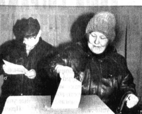
С самого утра 27 января 2002 года жители кишлака Дурман Кибрайского района пришли на избирательный участок № 470, чтобы выполнить свой гражданский долг. В этот день сельчане выразили свое отношение к вопросам, вынесенным на референдум. НА СНИМКАХ: на избирательном участке № 470 в Кибрайском районе.