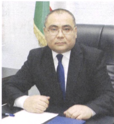
Иброҳим АБДУРАҲМОҲОВ, Ўзбекистон Республикаси инновацион ривожланиш вазири

Янги ишланмаларни аҳолига етказиш яшаш шароитини яхшилаш чораларидан бири