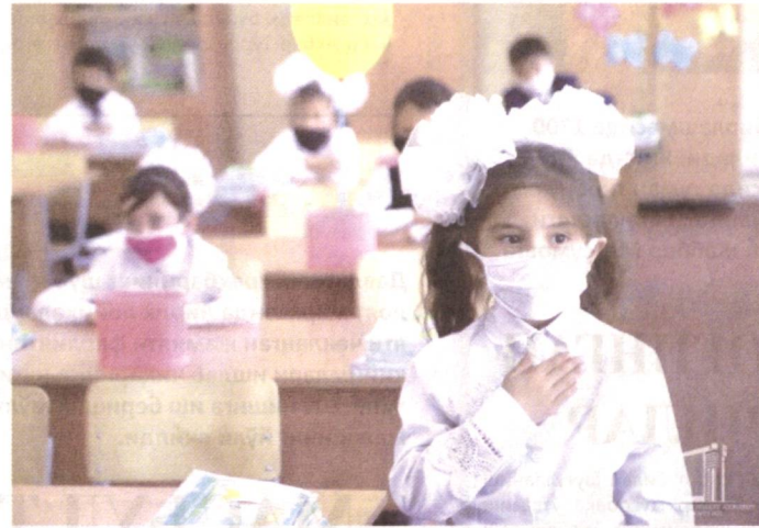
7 сентябрда 329 та мактаб фаолиятини бошлади, дея хабар бермоқда Халқ таълими вазирлиги матбуот хизмати.

Санитария-эпидемиология ва осойишталик марказлари 5 сентябрда қадар мактабларнинг янги ўқув йилига тайёрлик ҳолатини ўрганиб, жамоага қўшимча ўқув-тренинглар ўтказди, бундай тренинглар давом этмоқда.