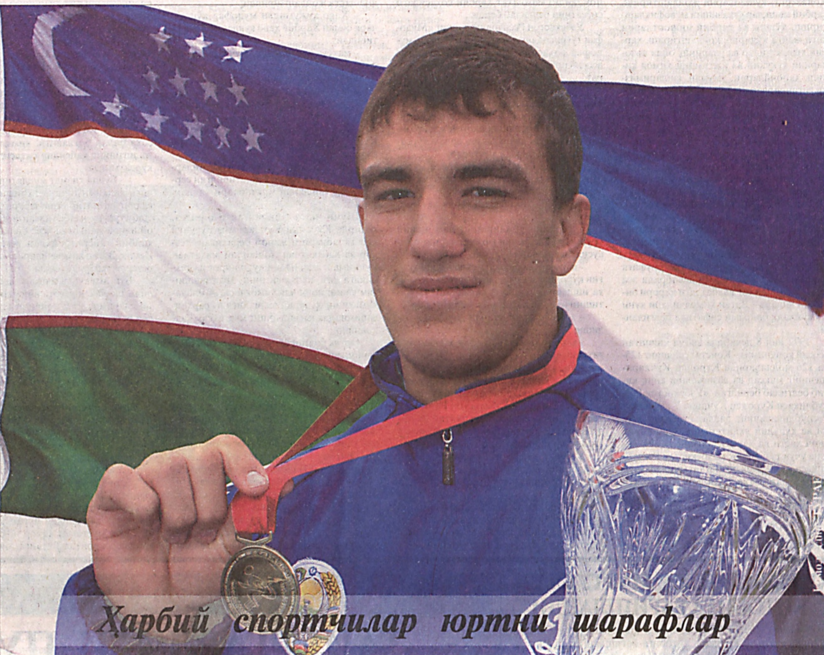
Ҳарбий спортчилар юртни шарафлар

лари гапи бежиз айтилмаган. Истиқлол йилининг ўтган ўн тўртинчи йили ҳам муҳим воқеа-ҳодисаларга бой бўлди. Тараққиёт йўлидаги салмоқли ютуқлар, қувончли воқеалар билан бирга оғир синовларни ҳам бошдан кечирдик. Озод мамлакатимизга муҳим балоларни ёғдирмоқчи бўлган қора кучлар Андижон воқеалари мисолида ўз жирканч қиёфаларини яна бир қарра кўрсатишга уринди. Жаҳонда эса... бунга қараб дуст-хайрихоҳларимиз астойдил қайғуришди, кимлардир чапак чалди. Ўзбекистоннинг яна қаерида бир тугун чиқаркин ёнқи Тошкентнинг қайси бир маҳалласиданги симёғочда лампочка куяркин дея жар солишга илҳақ турган айрим хорижий радио ва уларнинг чаққон муҳбирлари ёлгон амлалар ютиш маҳоратини намойиш қилишди. (Давоми 3-бетда).