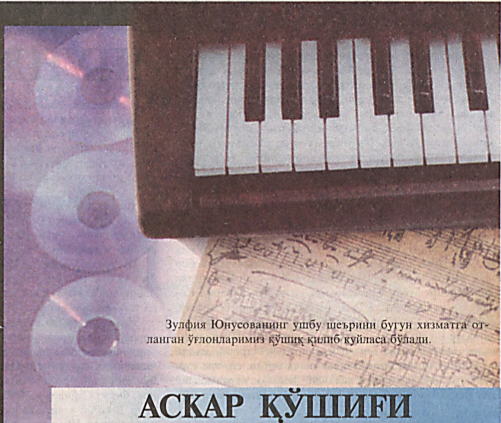
Зулфия Юнусованин ушбу шеърини бугун хизматга оланган ўғлонларимиз қўшиқ қилиб қуйласа бўлади.