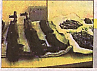
В школе найдены взрывчатка и автоматы

Новое правительство Италии во главе с Романо Проди приведено к присяге.