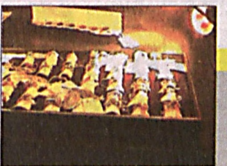
Похищены драгоценности на 2 млн. долларов

В зоне крушения лайнера А-320 продолжается третий этап поисковой операции.