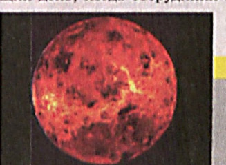
Гигантские волны из серной кислоты

В индийском городе Хайдерабад из ювелирного магазина похищены ценности на сумму 100 миллионов рупий (более 2 млн. долларов).