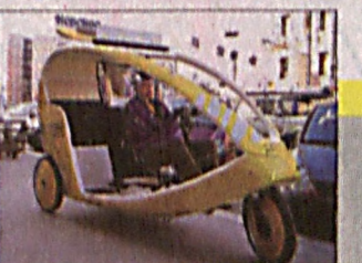
На улицах – велорикши

На поверхности ядовитых кислотных облаков Венеры астрономы разглядели загадочную рыбу грандиозных размеров.