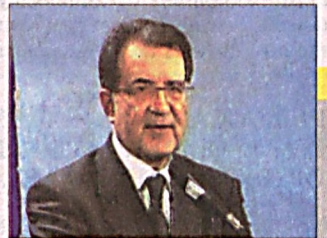
Правительство Италии приведено к присяге

В неполном составе открылась в Минске 35-я Европейская региональная конференция Международной организации уголовной полиции – Интерпола.