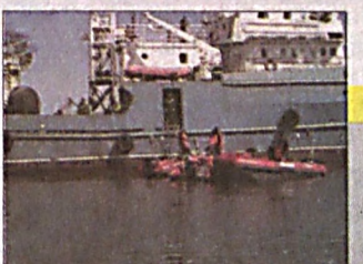
Третий этап поисковой операции

На спортплощадке шк. N7 в дагестанском городе Кизилюрт найдены шесть тротильных шашек, два автомата Калашникова, три магазина к ним, граната РГН и 40 глыб разного калибра.