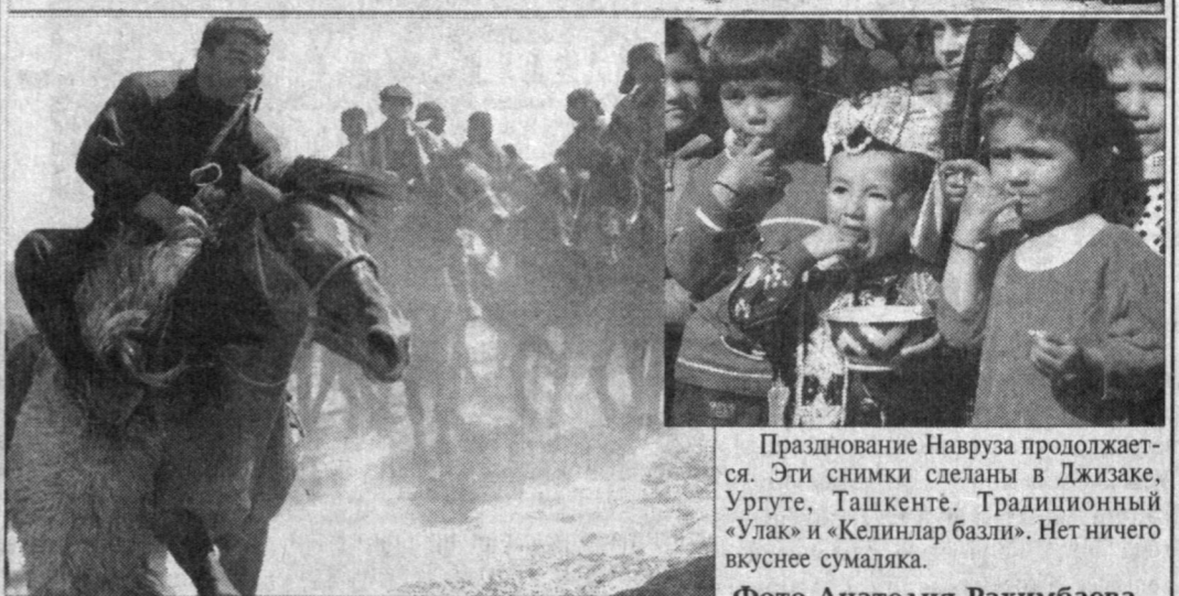
Празднование Навруза продолжается. Эти снимки сделаны в Джизаке, Ургуте, Ташкенте. Традиционный «Улак» и «Келиндар базми». Нет ничего вкуснее сумалика.