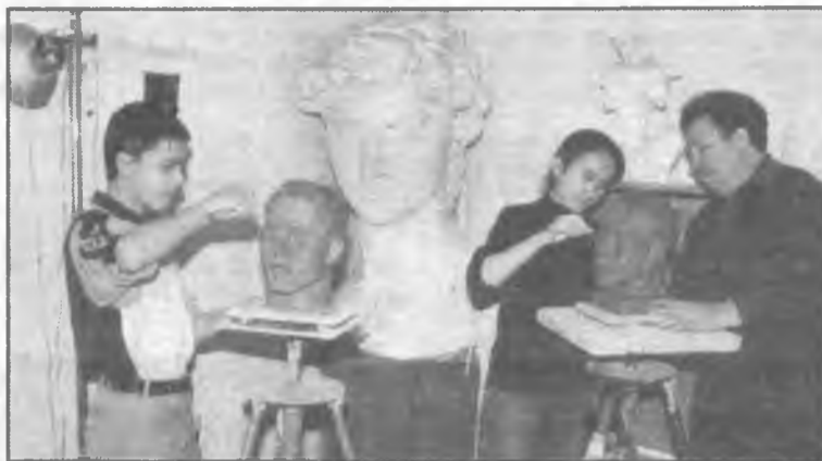
Республиканскому лицей-интернату изобразительного и прикладного искусства Академии художеств Республики Узбекистан исполняется 75 лет.