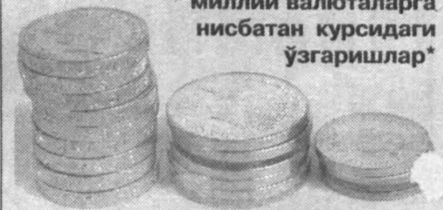
1 АҚШ доллари

2006 йил 4 июлдан 10 июлгача бўлган даврда АҚШ долларининг миллий валюталарига нисбатан курсидаги ўзгаришлар*