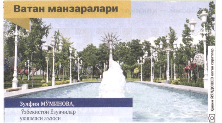
Зулфия МҮМИНОВА, Ўзбекистон Ёзувчилар уюшмаси аъзоси