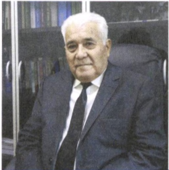
Ахмадали АСҚАРОВ, тарих фанлари доктори, академик

“Мовий осмон остидаги музей”га айлантирилади