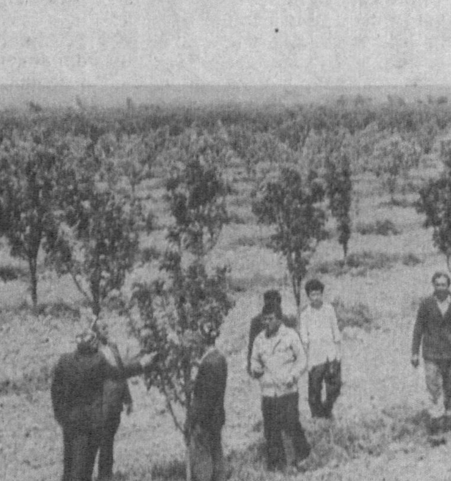
Сирдарё вилояти Гўлжистон туманига қарашли Баҳор давлат ҳўналиғида бундан 2—3 йил бурун 13 гектар майдонга мевали дарахлар экилиб, боғ барпо қилинган эди...