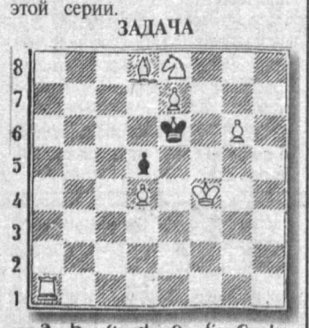
Мат в три хода. Ждем ваших решений!