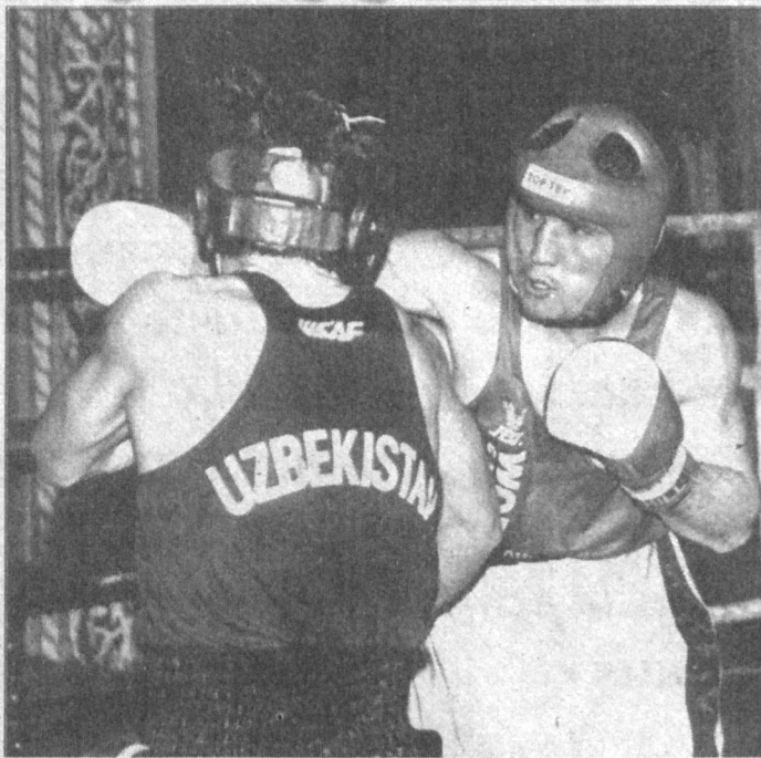
Более 120 мастеров кожаной перчатки оспаривали право называться чемпионами Узбекистана в последнем чемпионате республики в ушедшем тысячелетии в городе Гулистане. Тренеры команды определили состав на 2000 олимпийский год.

Впереди много стартов, пожелаем нашей славной боксерской дружине новых успехов в олимпийский год.