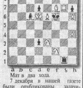
Мат в два хода. ЗАДАЧА