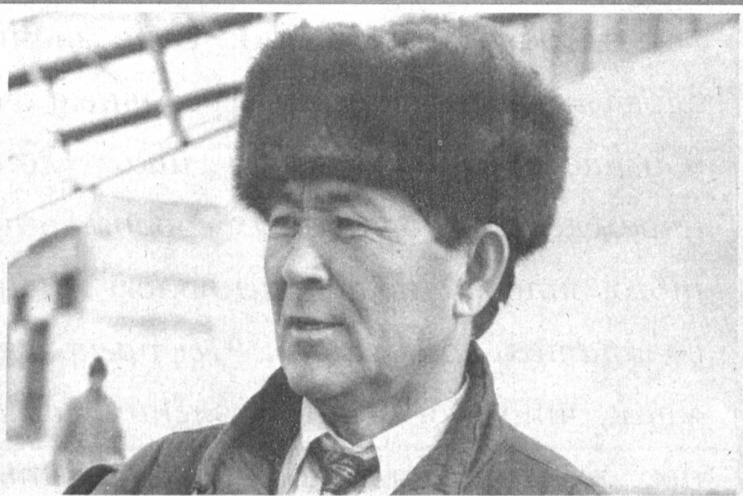
Фот. И. Хужаева (УзА). Сурхандаринская область.

Накануне 2000-летия в Кумкурганском районе слано в эксплуатацию совместное предприятие «Олтин чигит» Узбек-Юнон (Греция).