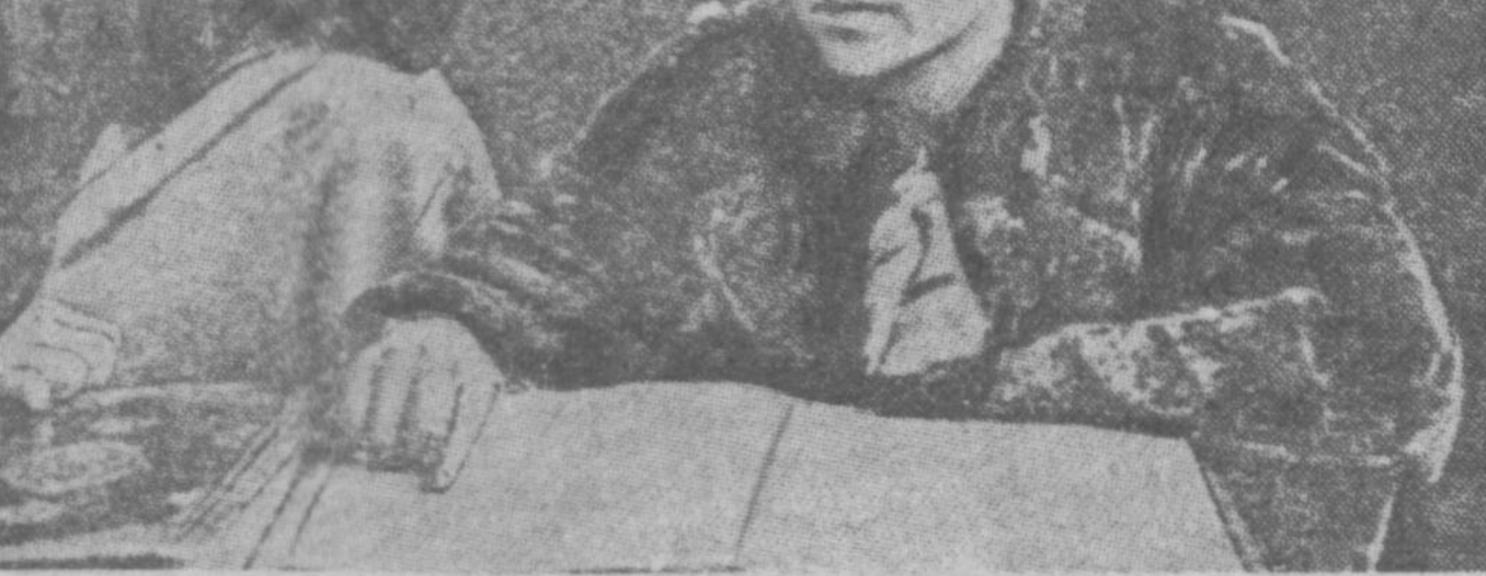
Ушбу сурат 1941 йилда Алишер Навонийнинг 500 йиллик юбилей арафасида Самарқандда олинган...