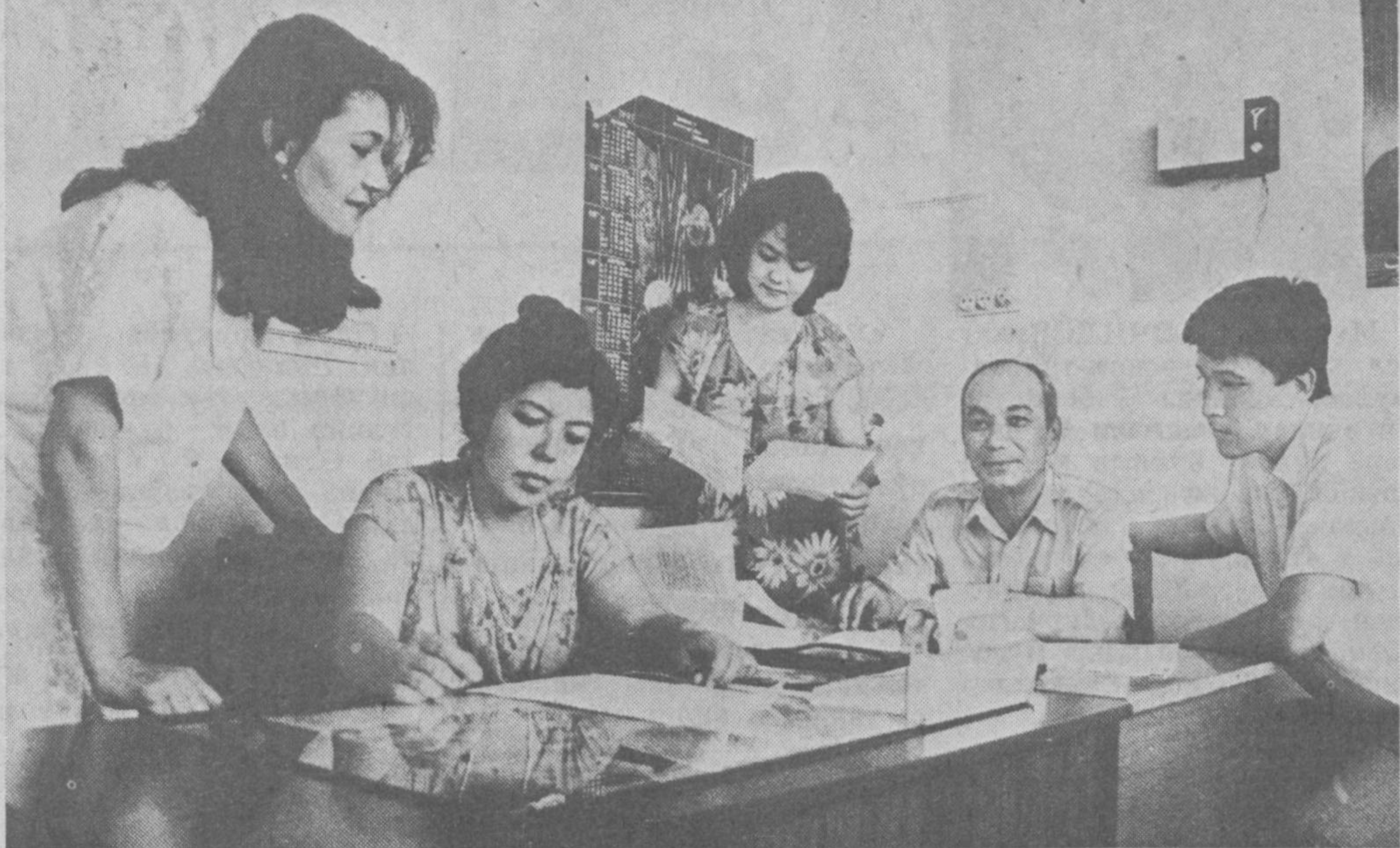
«Ватандошлар» эшиттириши жамоа аъзолари