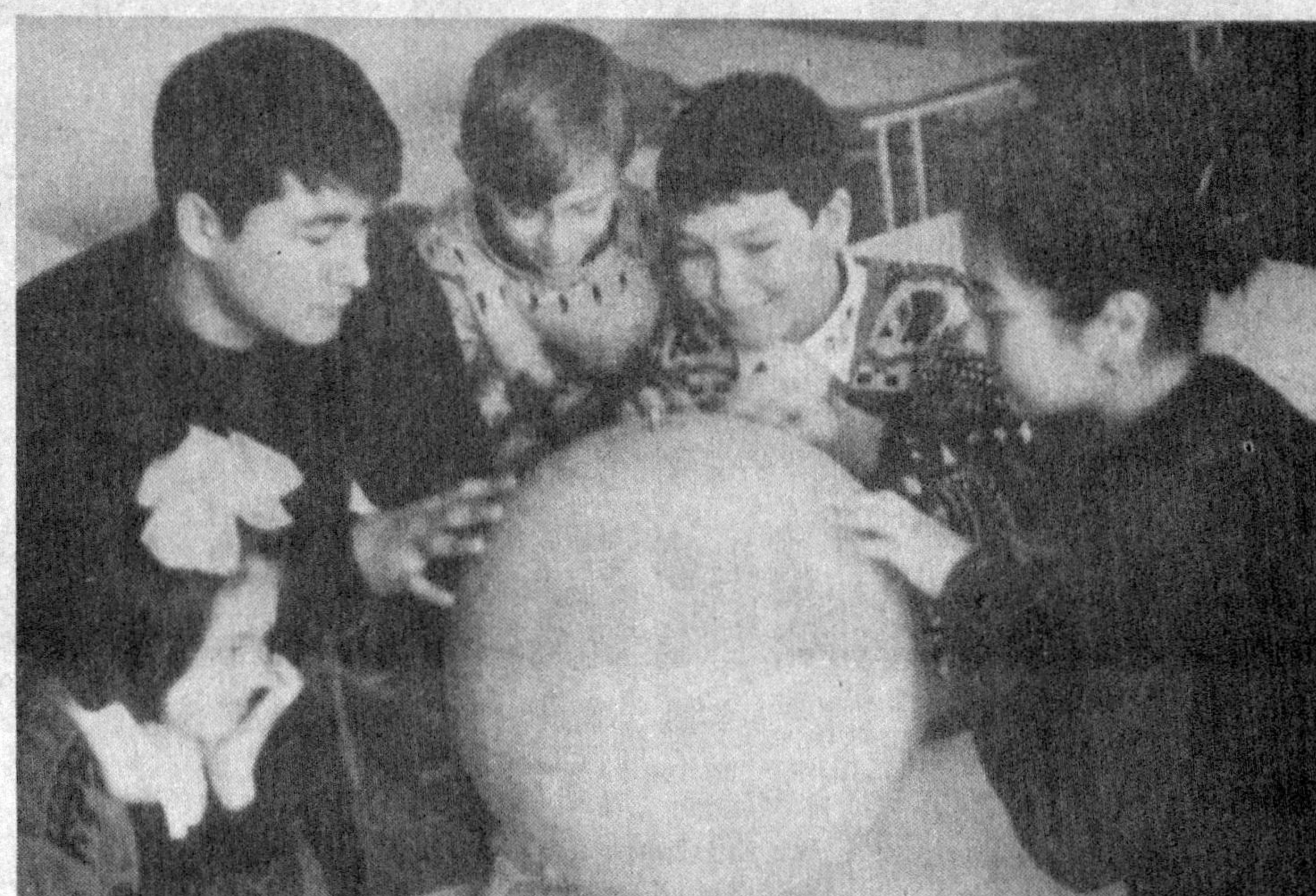
Фазогир ўқиган мактаб ўқувчилари харитадан Флорида штатини излашмоқда