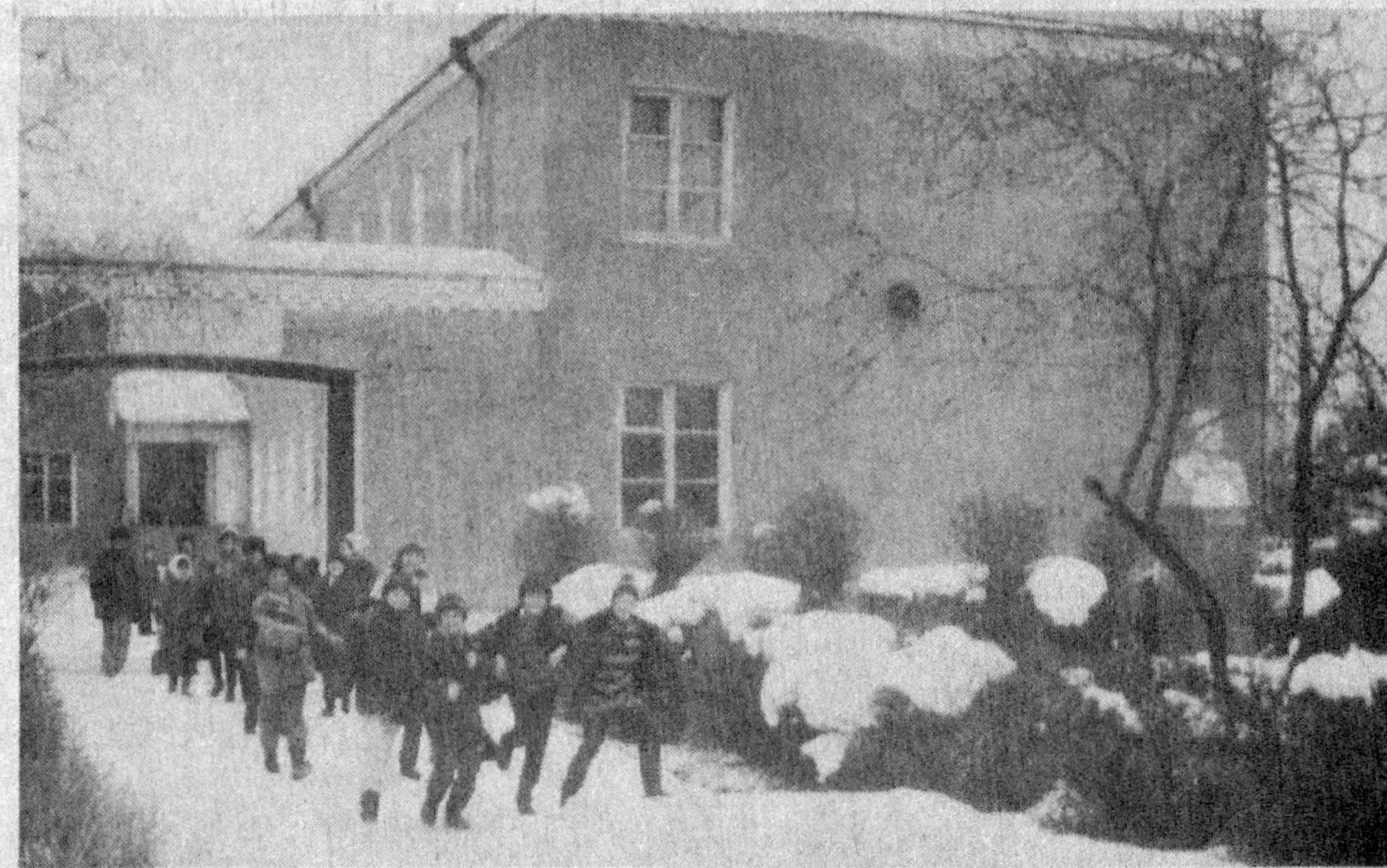
Болалиқни улғайтган мактаб