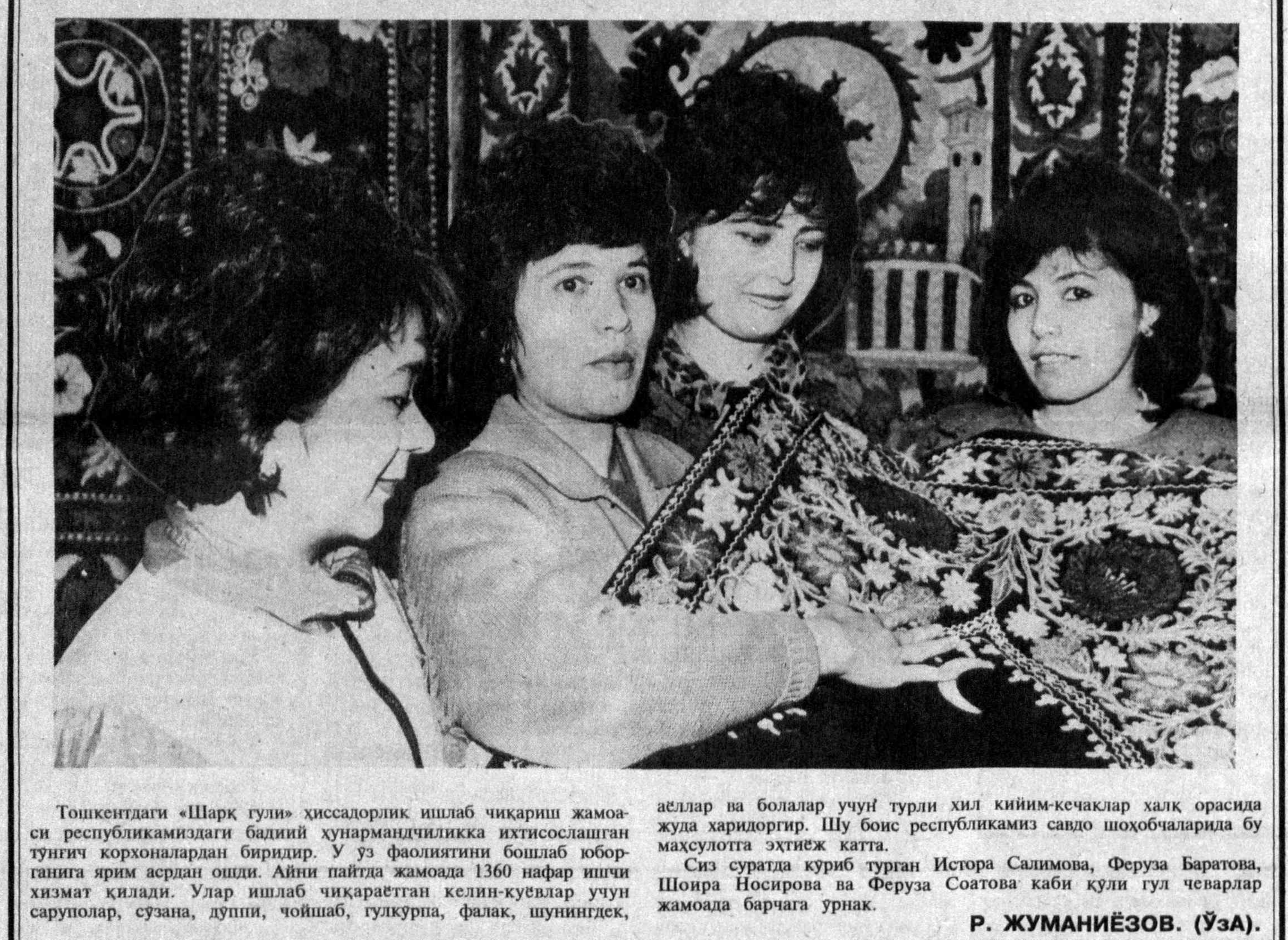
Тошкентдаги «Шарқ гули» хиссалорлик ишлаб чиқариш жамоаси республикамиздаги бадий ҳунармандчиликда ихтисослашган тунгич қорхоналардан биридир. У ўз фаолиятини бошлаб юборганига ярим асрдан ошди. Айни пайтда жамоада 1360 нафар ишчи хизмат қилади. Улар ишлаб чиқаратган келин-қувалар учун саруполар, сўзана, дуппи, чойшаб, гулқурпа, фалак, шунингдек, аёллар ва болалар учун турли хил кийим-кечаклар халқ орасида жуда харидордир. Шу боис республикамизда савдо шохобчаларида бу маҳсулотга эҳтиж катта.

Журналистнинг қурол қалам бўлса, минайри матбуотдир. У ўз сўзини кўп миғ соғли мунга берса, яъни халққа шу минбардан туриб гапирди. Аслида бу минбарга чқикчидан мақсад нима? Аббатга, она юрт, жамият, халқ эзу манфати, ҳоҳиш яроқлиш ифодалиб фикрларини, баҳс мунозара қилиш учун.