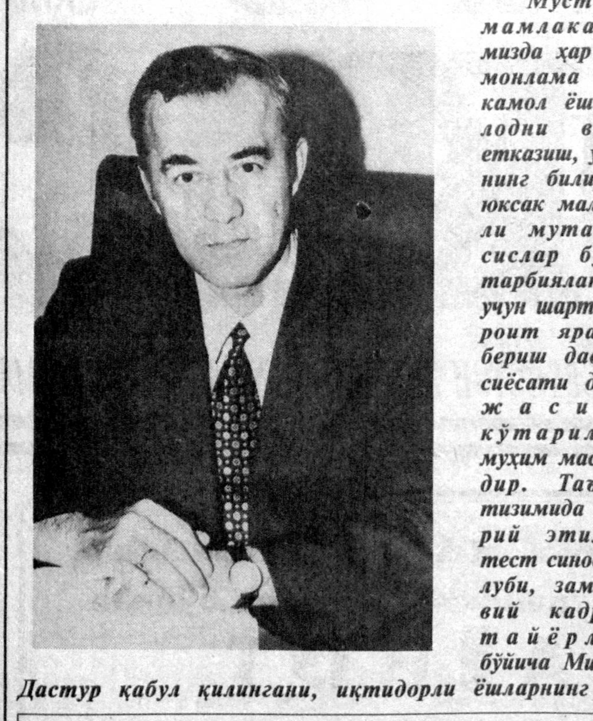
Дастур қабул қилингани, иқтидорли ёшларнинг ҳар

муваффақиятли равишда таҳсил олишяпти. Бунга далолат сифатида АҚШ олий ўқув юртоларида таҳсил олаётган 99 нафар Ўзбекистонлик йигит-қизларнинг Мустақил Давлатлар Хамдўстиги давлатларида юборилган ёшлар ҳамда АҚШ талабаларига нисбатан бирмунча юқори натижаларга эришганликларини мисол қилиб келтириш мумкин. Ўзбекистонлик талабалар АҚШдаги 4 баллик баҳолаш тизимида 3,35 балл олишга мўъссар бўлиб, олий ўқув юртолари раҳбариятининг таҳсил бераётган ўқитувчиларнинг катта эҳтиромига сазовор бўлишди.