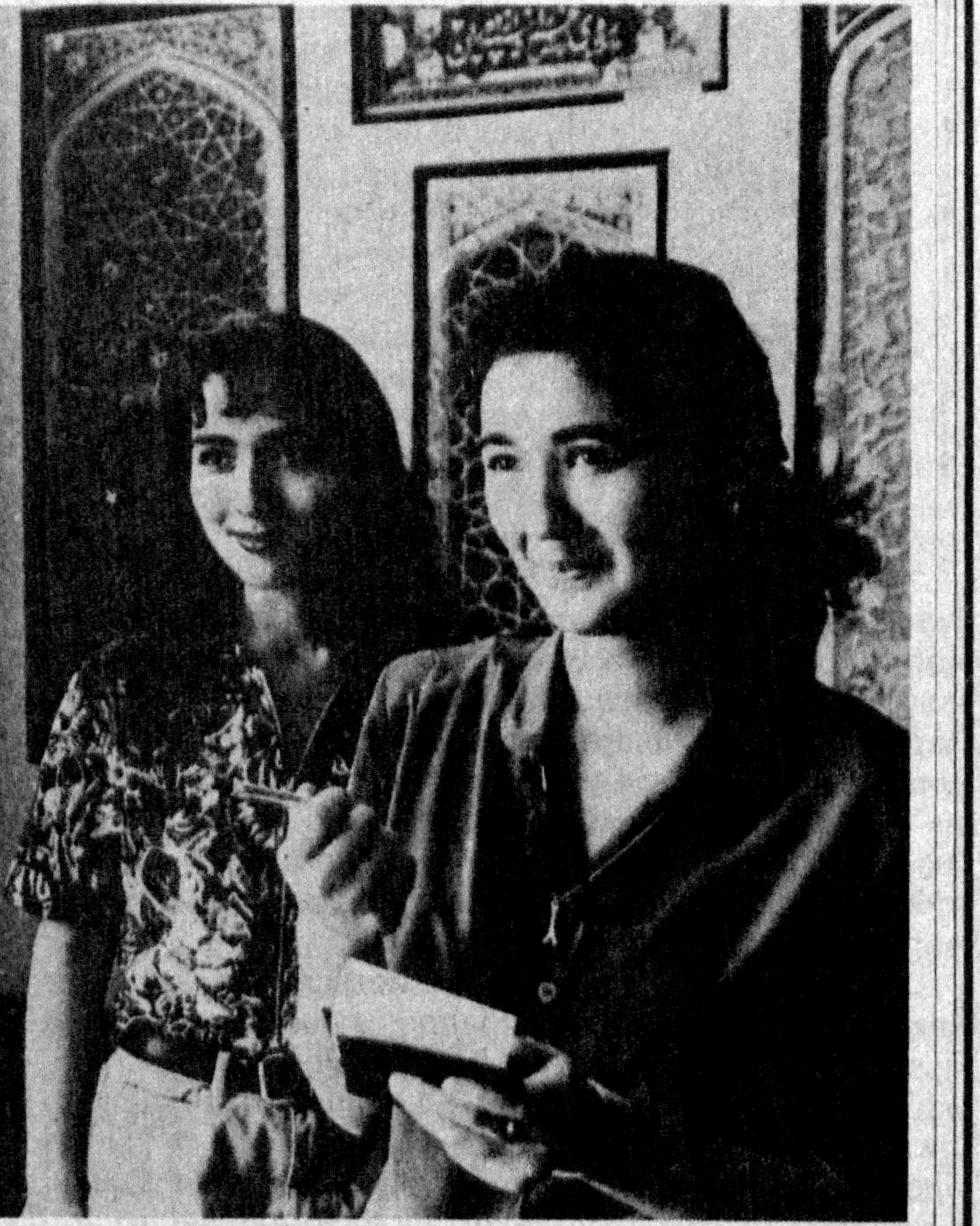
1997 йилда вилоятлардаги олий ўқув юртлари ҳамда ўрта мактаблардан 61 нафар истеълодли талаба ва ўқувчи «Камолот» стипендианти бўлди.