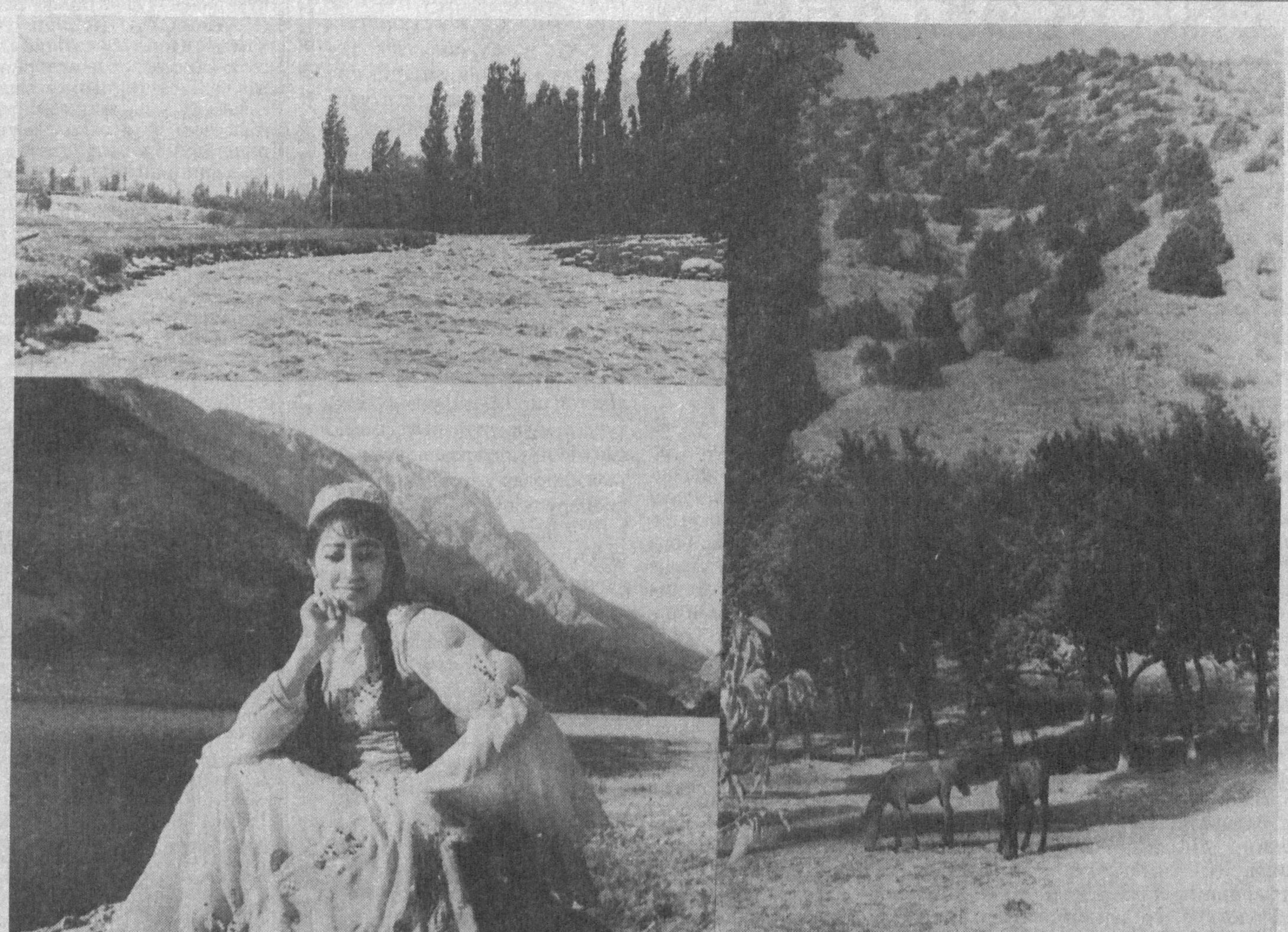
Нурдуста ҳуснидан олам — мунаввар, Новдалар эғнида — кўкпалак шоҳи. Шалала бошида камалак — чамбар, Қизарар гунчанинг қўқоқиш дудоғи. Пардозга тутиниб нурланар Замин, Дурланар — далада увишган тупроқ.

Ҳозир нима кўп — китоб кўп, нима осон — китоб чиқариш осон. Китоб расмлари кўпайганидан кўпайиб бормоқда. Бозорларда, кибитчаларда, ер ости йўлаклариди сотилаётган кўпгина қамаштирувчи китобларни кўриб, хайратангиз ошадди. Китоб — офтоб, китоб — зий, қанча кўпайса, қанча кўп ўқилса шунча яхши. Одамлар поезида, метрода ва ҳатто автобусларда китоб ўқишмоқда. Китобхонлик ҳақиқатан маънавий даромад манбаи бўлиб келган. Баски, бундай ҳолатдан қувонадиганимиз мумкин эмас.