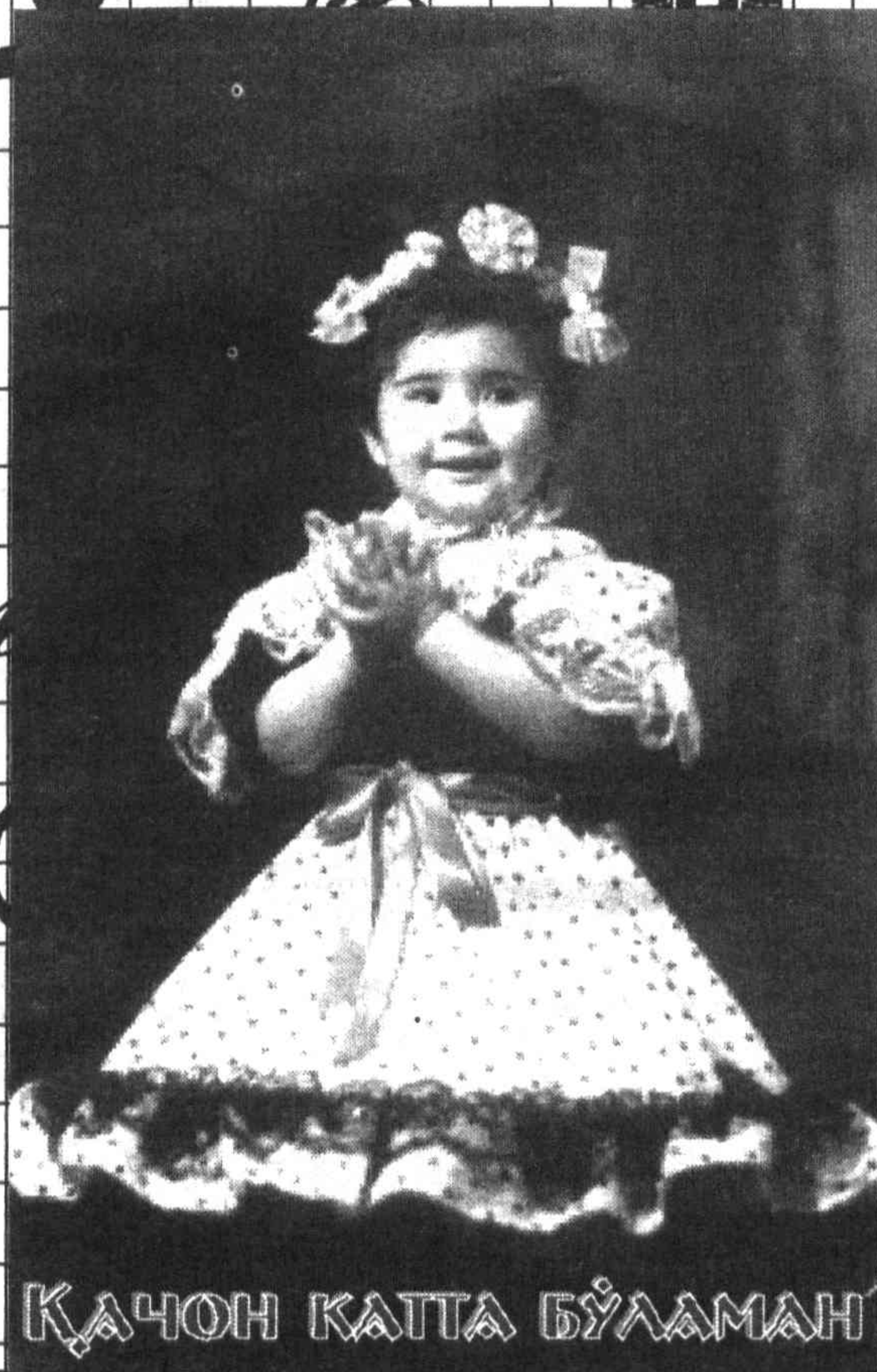
ҚАЧОН КАТТА БЎЛАМАН

Биз шундай савол билан турли билимгоҳларда таҳсил олаётган ёшларга муурожаат этдик.