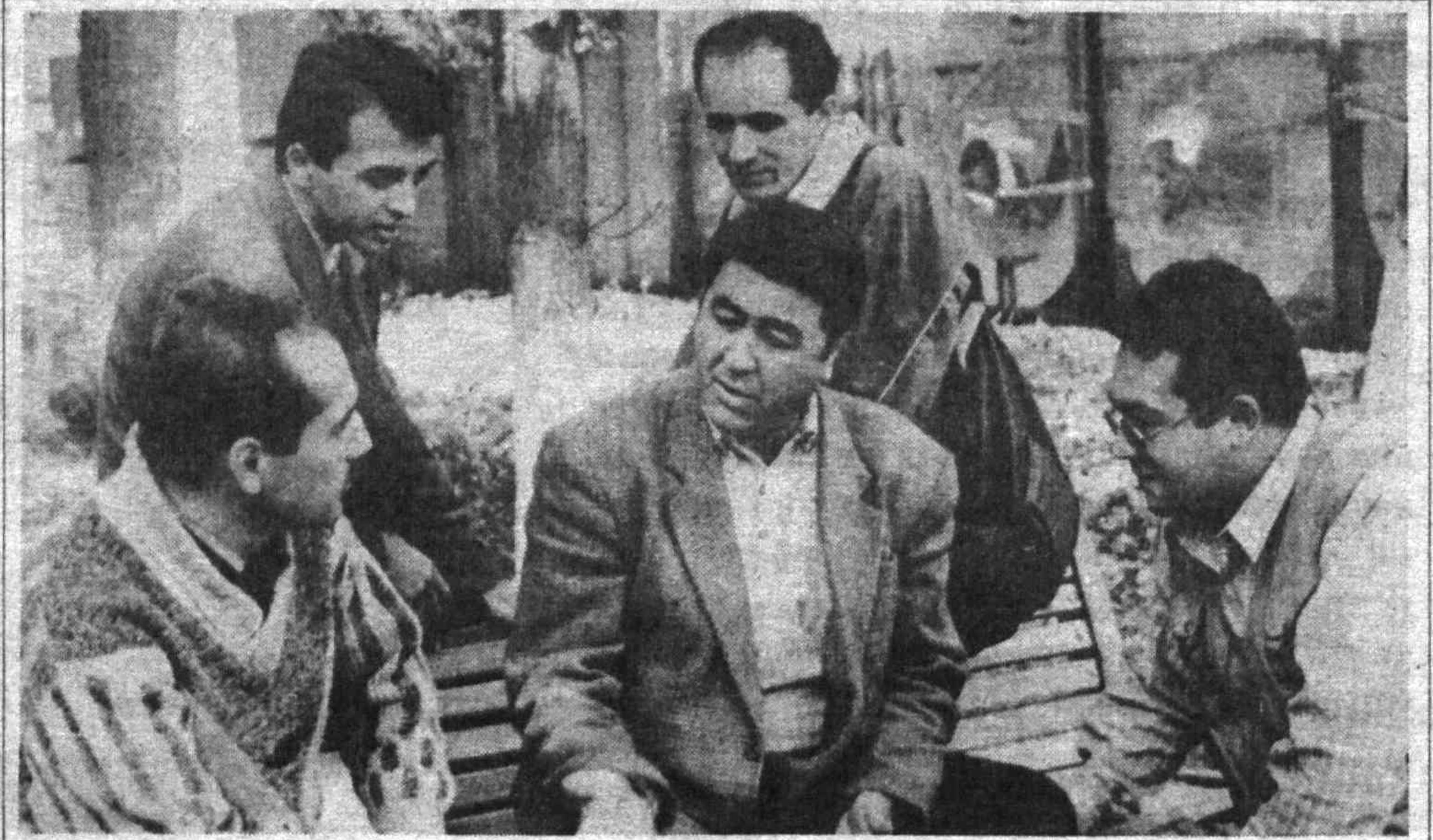
Суратда Сиз мириқиб томоша қилаётган «Ёшлар» телеканали ижодкорларидан бир гуруҳи акс этган

Эрвин бундай муваффақиятга тўрт оми: совуққонлиги, сабрбардоши, ишбилармонлиги ва албатта ички сезгиларига қулоқ тутгани туфайли эришган. "Вельт" газетаси мухбирининг энди нима билан шуғулланасан, деган саволиға ёш миллионер шундай жавоб берди: "Шифокорликка ўқийман, бўш вақтимда бизнес билан машғул бўламан".