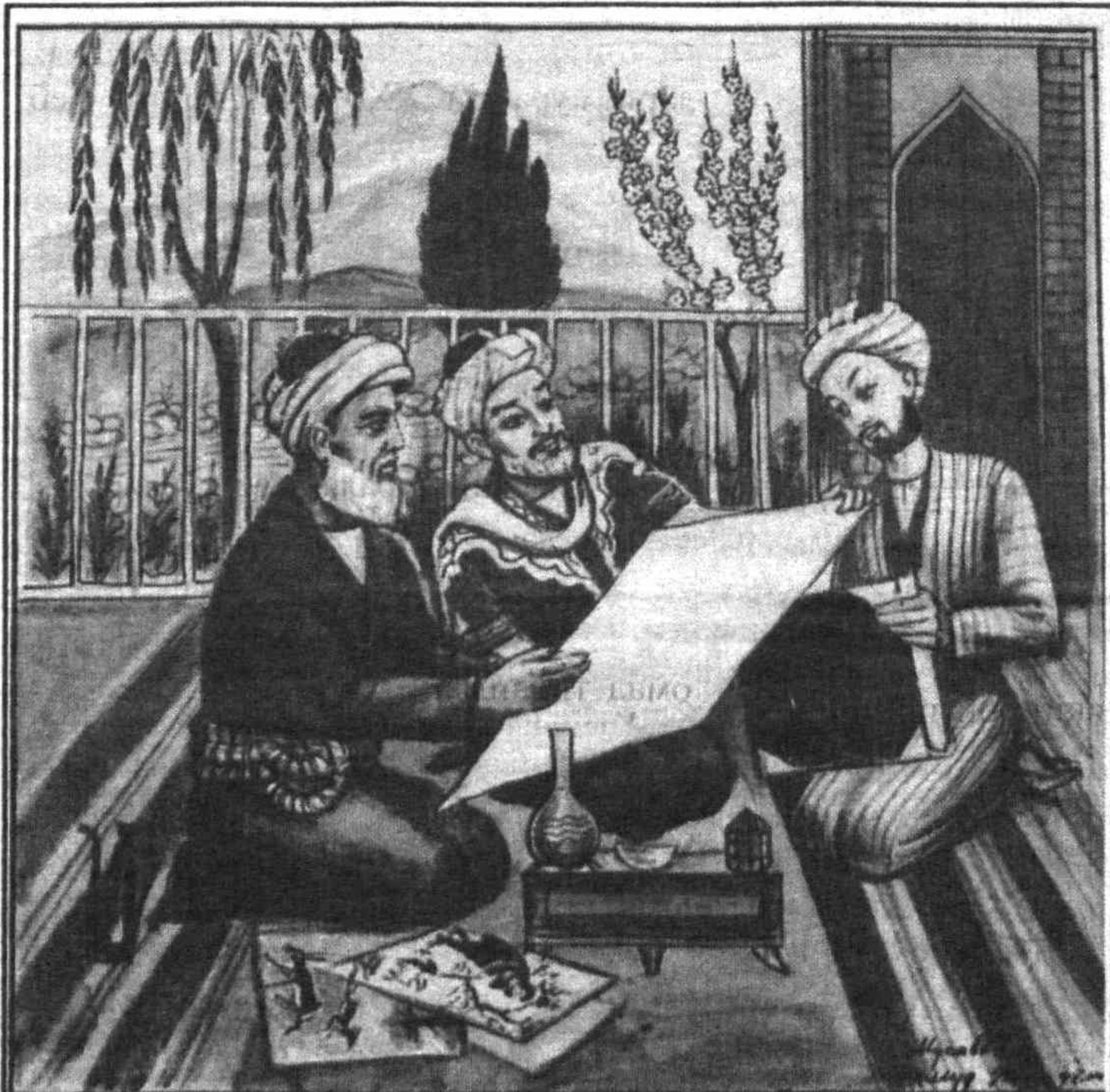
Навоий Жомий ва Беҳзод билан

Навоий, фироқингдан анингдек заиф ўлди, Ки, ўрнида эл боқса дегайлар, магар йўқдир.