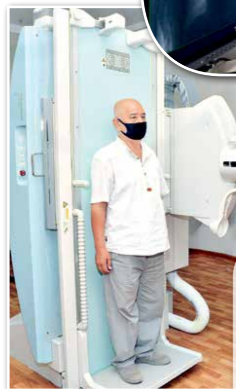
помощи развитию правительства Японии.

– Структура нашего диспансера состоит из поликлиники, 10 клинических и 3 ди-