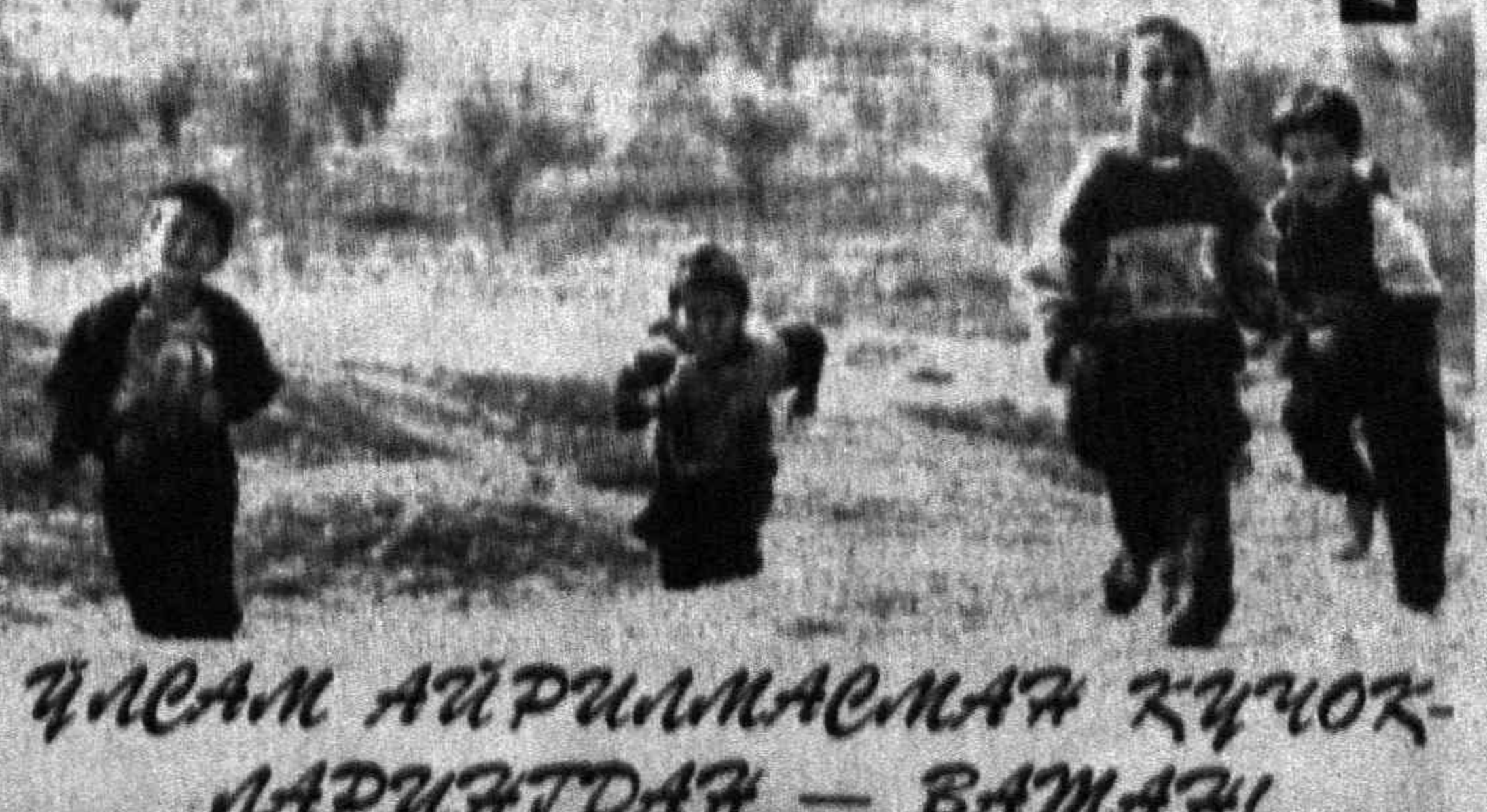
ҚИСМ АЙРИЛМАСМАН ҚУЧОҚЛАРИНДА — ВАТАН!