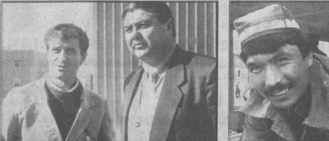
В Касансе рядом с узбекско-турецким СП «Косонсай-Текмен» строится 24 современных коттеджа для работников предприятия...