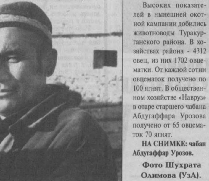
Высоких показателей в нынешней охотничьей кампании добились животноводы Туракурганского района. В хозяйстве района - 4312 овец, из них 1702 овечатки. От каждой сотни овцематок получено по 100 ягнят.