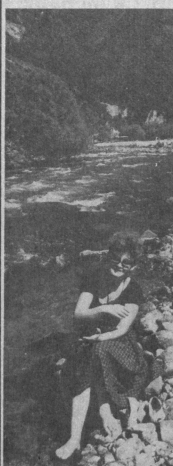
Последний солнечный денек.