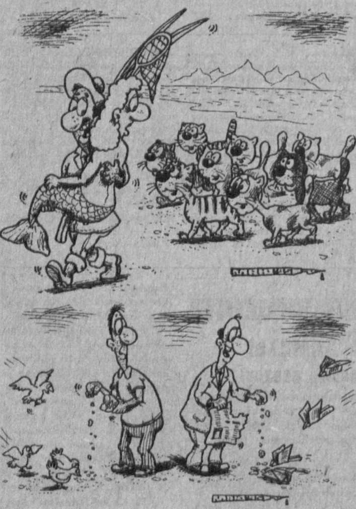
Рис. Александра Маркелова.