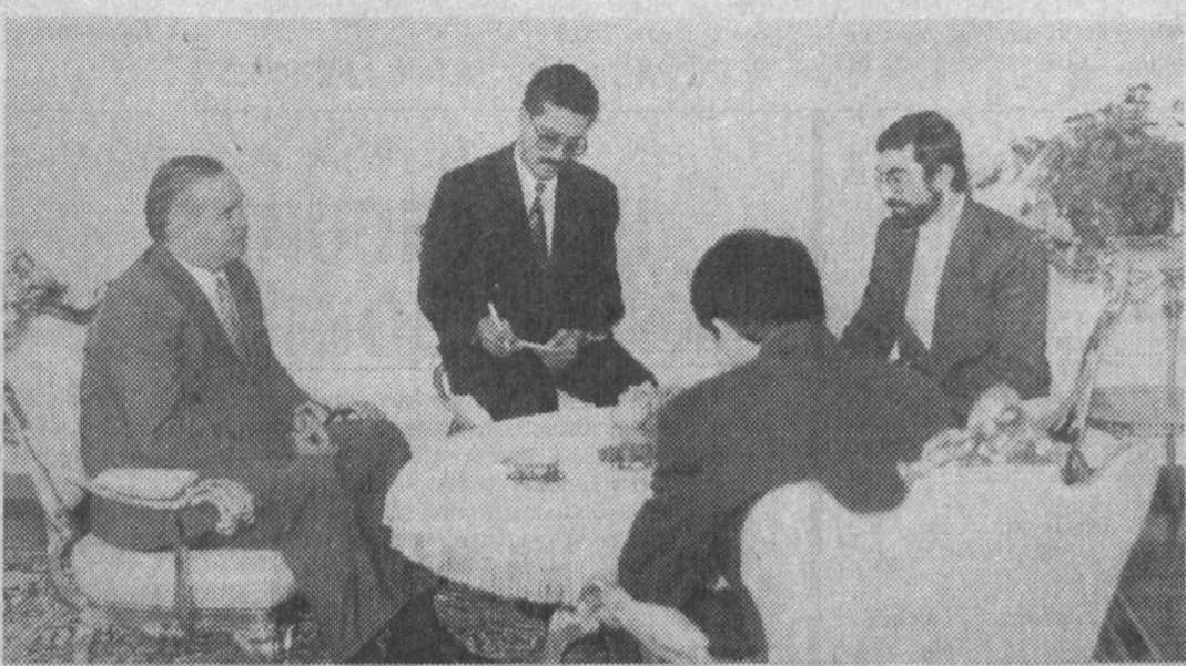
НА СНИМКЕ: во время приема.

УЧРЕДИТЕЛЬ - КАБИНЕТ МИНИСТРОВ РЕСПУБЛИКИ УЗБЕКИСТАН