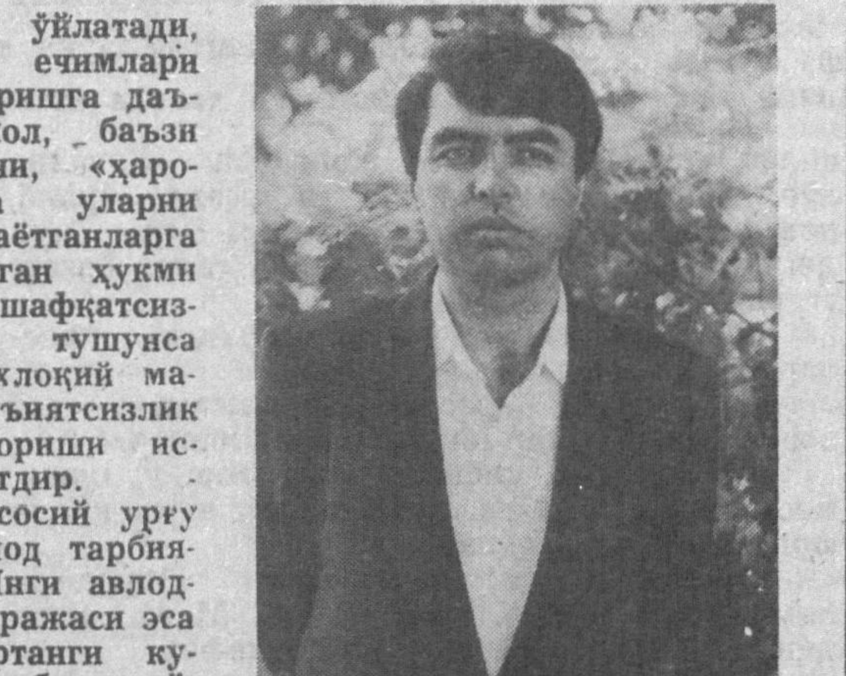
Ҳалим Сайиддиннинг жумҳурият мабтуотида босилган чизма...