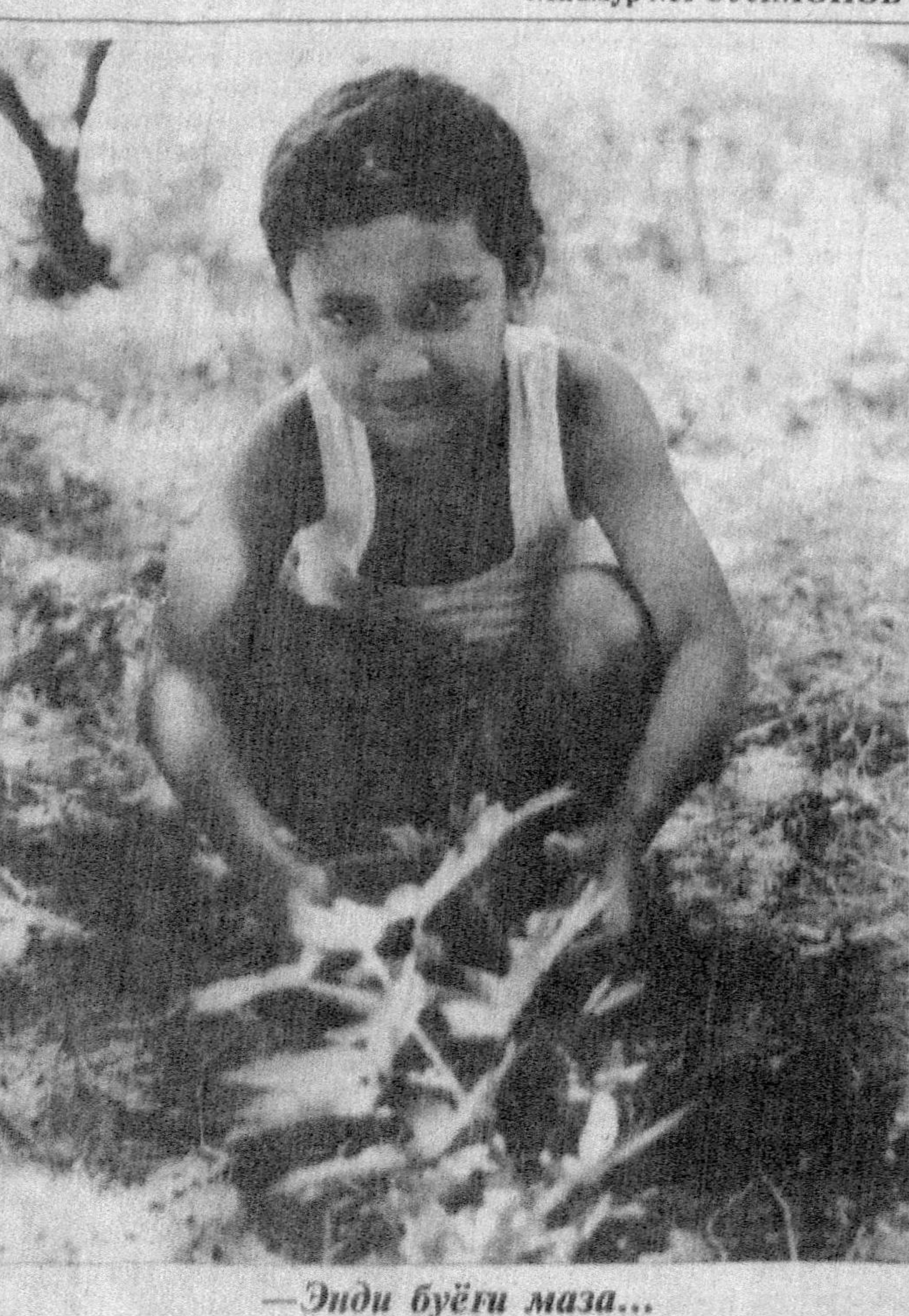
— Инди бўёғи маза...