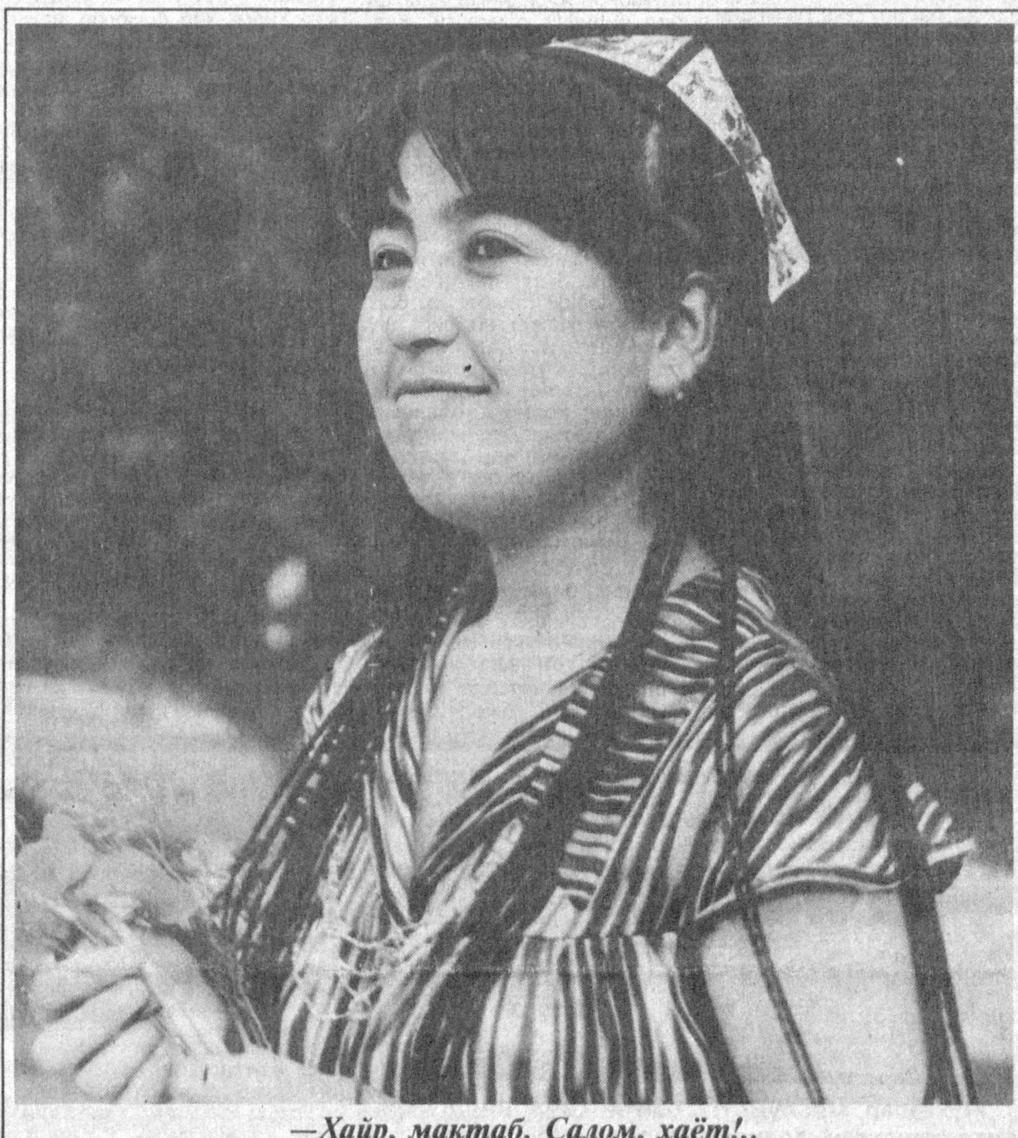
—Хайр, мактаб. Салом, ҳаёт!..

Бир сўз билан айтганда, Президентнинг ушбу Фармойиши жамоатчиликни кўп улуг ва савоб ишта чорламоқда. Бу тарихий ҳужжат миллатимизни анад ментиндек бирлаштиришга хизмат этажак.