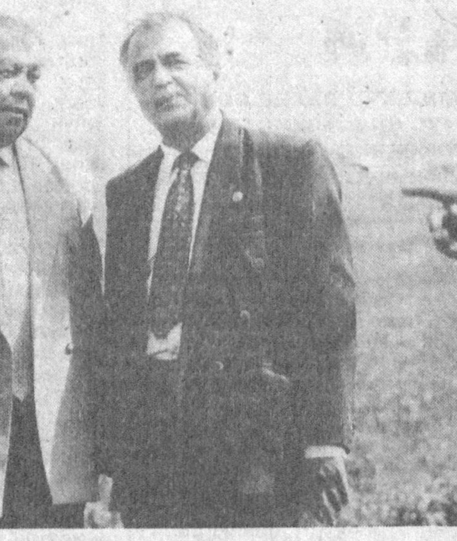
Шогирд ва Устоз