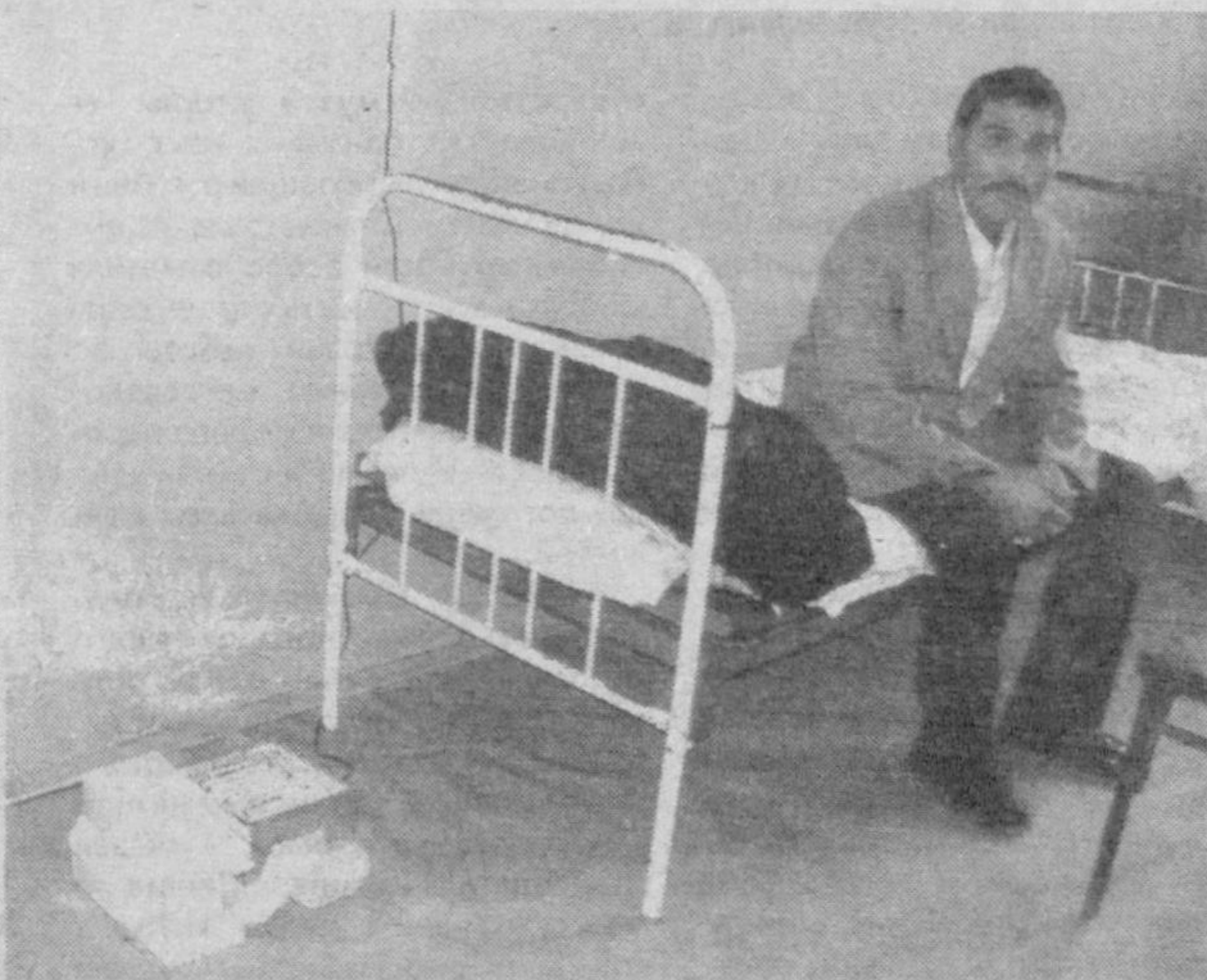
Фото - ФАКТ

"Готовься к зиме летом" - так гласит народная мудрость. Но об этом, видимо, забыли в инфекционной больнице кишлака Бачкир Бувайдинского райздравотдела. В палатах нет отопления. Сырость и холод становятся причиной простудных заболеваний.