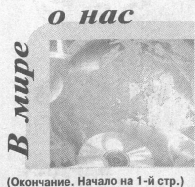
(Окончание. Начало на 1-й стр.)

Все решения по использованию водотока трансграничных рек, в том числе при строительстве гидроэнергетических сооружений, не должны ни в коей мере наносить ущерба экологии и ущемлять интересы населения стран на сопредельных территориях. Необходимо подчеркнуть, что речь идет об использовании ресурсов и водотоков трансграничных рек, на протяжении столетий обеспечивающих жизненно важные потребности государств и народов, проживающих по стоку этих рек».