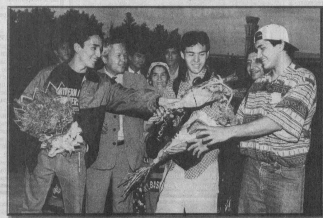
В целях поддержки одаренной молодежи и организации ее обучения в зарубежных странах по инициативе Президента Ислама Каримова создан фонд "Умид".