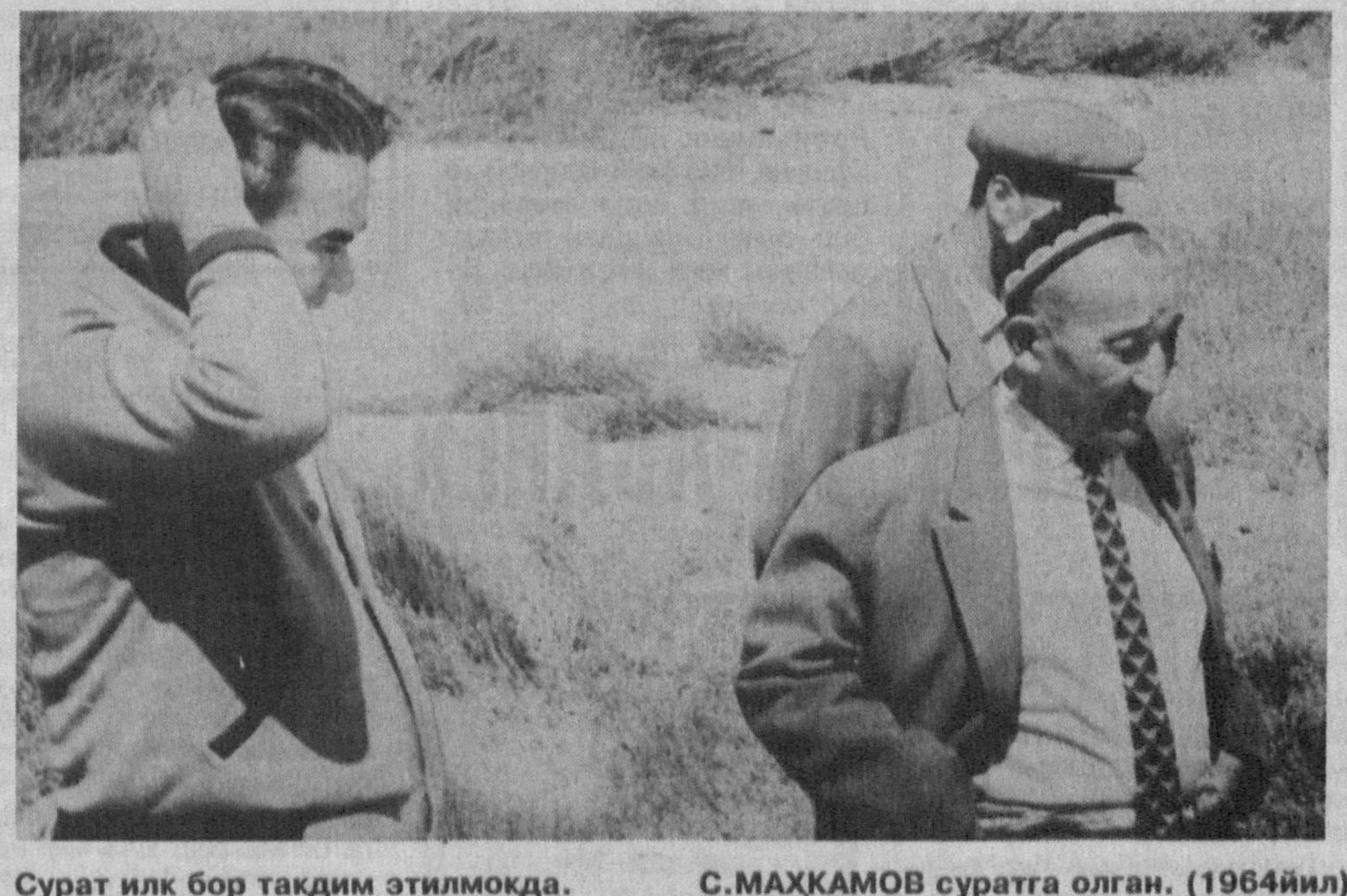
Сурат илк бор тақдим этилмоқда. (1964йил)