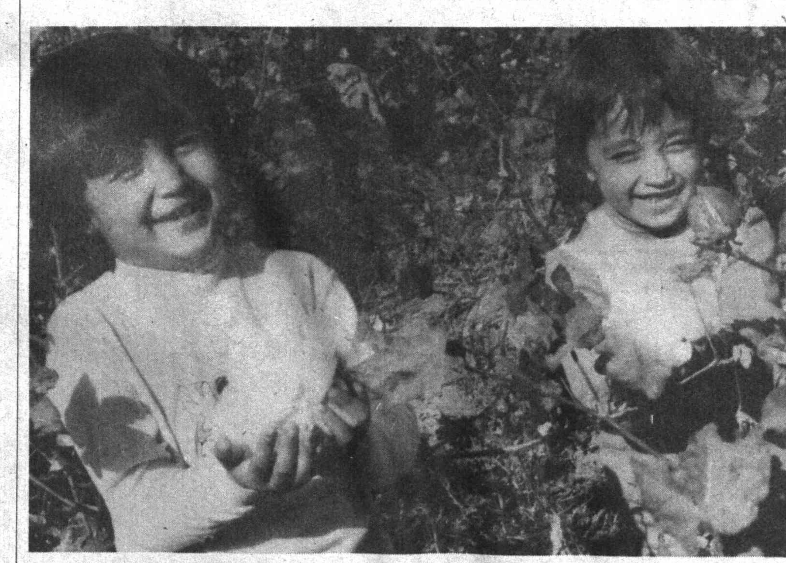
"Биз ҳам ҳашарчимиз"

Анжуман сўғида шўба раисларининг ахбороти тиллашиб, ўқилган энг ахши маърузалар бўйича махусе илмий тўплам чиқаришга келишиб олинди. НАЗОКАТ